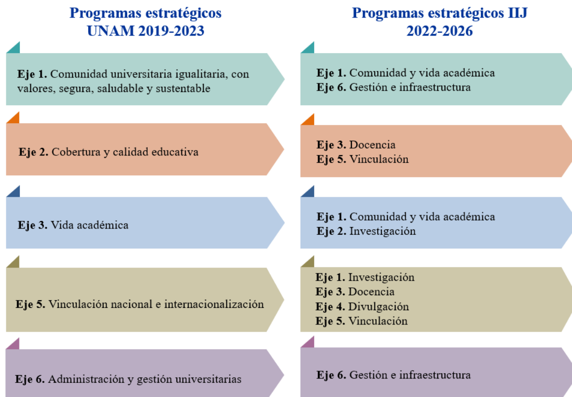
Imagen 4. Alineación al PDI 2022 -2026

(Véase versión desglosada por Ejes en el anexo 1).