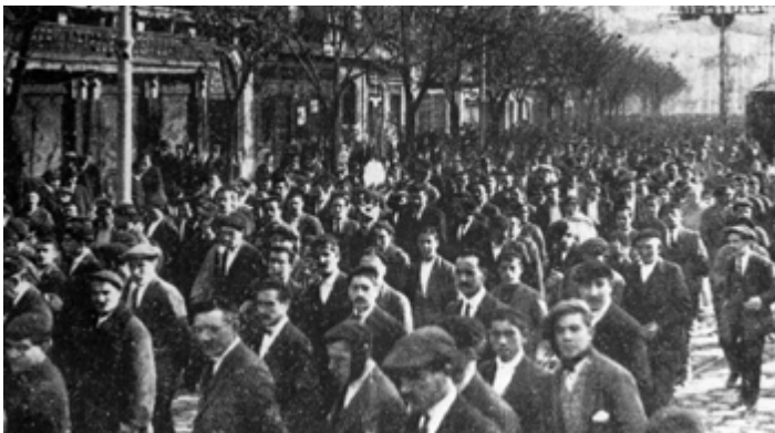
Manifestación de trabajadores.

Lo de los tribunales que proponía Victoria era más complicado. Se hablaba entonces de que debía establecerse un Tribunal Federal de Conciliación y Arbitraje. Esto quiere decir que fuera de todo el país. Pero además, significaba que este tribunal debía lograr la conciliación, es decir, ayudar a los obreros y patronos a ponerse de acuerdo en caso de conflicto, porque la nueva Constitución incluyó el derecho de los obreros a la huelga, en caso de que se violaran las