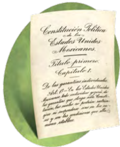
Constitución de 1917.

El Congreso se iniciaba el primero de diciembre de 1916, pero antes era necesario que se revisaran las credenciales de los diputados, para ver si su elección había sido correcta. En algunos casos hubo dudas, pero todo quedó arreglado.