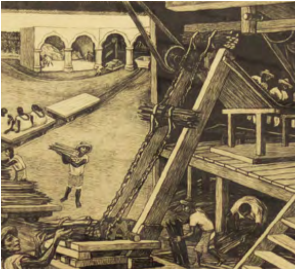
Trabajadores de henequén.

ses. Con él se pudo dar la alianza entre los trabajadores yucatecos y los revolucionarios constitucionalistas. Esto sucedió en 1915.