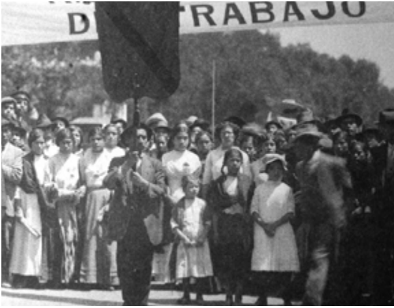
Trabajadores y sus familias.

Se estableció así que se debían laborar ocho horas diarias, las cuales configurarían un turno de trabajo. Si un obrero estaba de acuerdo en trabajar más, entonces se le deberían pagar horas extras. También se establecía un día de descanso semanal; y, si los dueños de alguna fábrica querían que permaneciera abierta y que la producción continuara, tenían que pagar extra la jornada de trabajo en día de descanso. Con eso se buscaba que el trabajador tuviera una vida más humanizada, es decir, que pudiera convivir con su familia, salir a pasear, distraerse