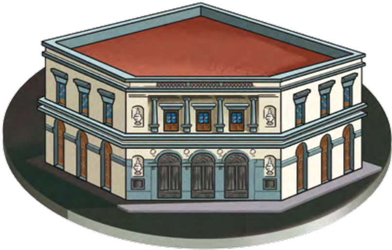
Teatro Iturbide, Querétaro.

En todos los demás estados no hubo problemas y se contó con una gran representación, esto quiere decir, que esos más o menos doscientos señores que resultaron electos diputados constituyentes, representaban a los mexicanos de todo el país. Y por cierto, el país se divide en distritos y en cada distrito se nombra a dos representantes, uno que es el principal y que recibe el nombre de propietario y otro que