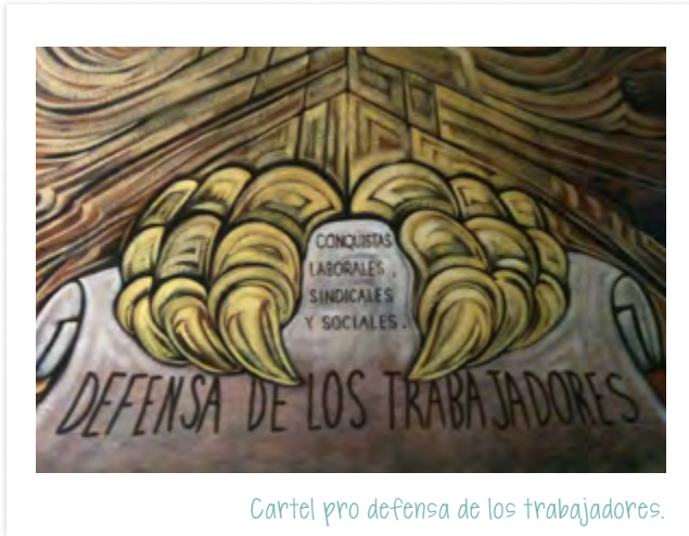
Cartel pro defensa de los trabajadores.

En las constituciones anteriores, no sólo en las mexicanas sino en las de otros países, sólo se garantizaba la libertad de trabajo. Pero el hecho de que se dijera en ellas todo lo que se debía observar en relación con el trabajo era algo completamente nuevo. El artículo 123 es largo y tiene muchas secciones. En ellas se menciona lo que propuso Héctor Victoria y, desde luego, más cosas que se les ocurrieron a otros diputados. El resultado fue convertir en ley lo que era un conjunto de aspiraciones de los obreros que pelearon en la Revolución por mejorar las condiciones de los trabajadores en general.