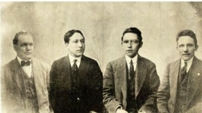
Diputación de Yucatán.

Héctor Victoria siguió luchando en favor de los trabajadores. Regresó a Mérida, donde en 1918 fue electo diputado para el Congreso del estado de Yucatán, donde estuvo sirviendo durante cuatro años, hasta 1922. Desde ahí apoyó a los gobiernos revolucionarios yucatecos de Carlos Castro Morales y Felipe Carrillo Puerto. Con