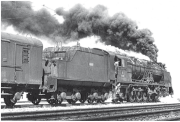
Ferrocarriles de vapor.

atención este medio de transporte y aprendió el oficio de mecánico ferrocarrilero.