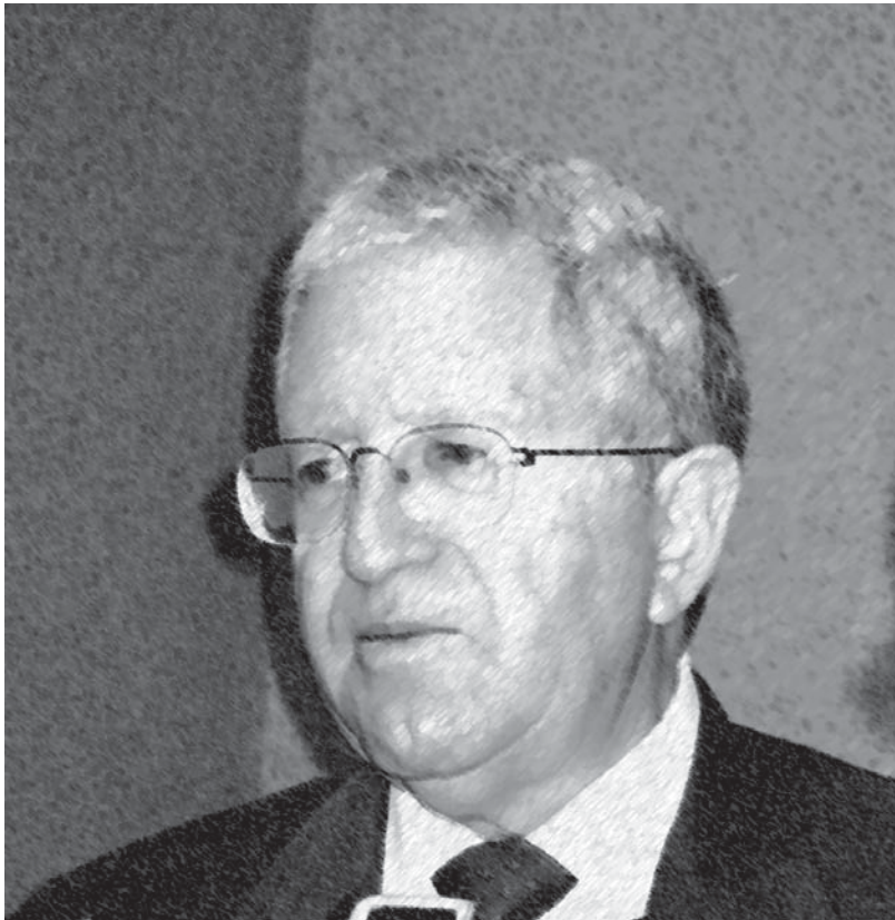
Modesto Seara Vázquez.

una clara intervención de las potencias fuertes en los asuntos internos de estos países hispanoamericanos. De tal modo, que los extranjeros en las repúblicas hispanoamericanas gozaban de un estatuto en el que, a la protección que las leyes territoriales les concedían, se unía el temor de que sus Estados intervinieran ejerciendo la protección diplomática, convirtiéndolos así en verdaderos superciudadanos, al punto de vista de los derechos de que gozaban.