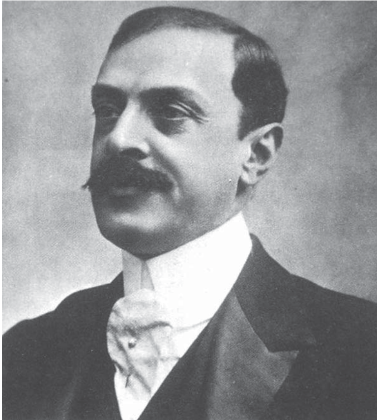
Luis María Drago.

potencia europea. Se oponía a cualquier dominio territorial europeo con el pretexto de una presión hacia objetivos de protección por cuestiones económicas.