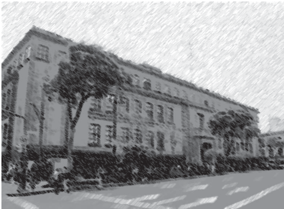
Suprema Corte de Justicia de la Nación.

Pero esta reforma no ha encontrado eco en un gran sector de la academia. Muchos penalistas de gran calibre han expresado su opinión en diversas publicaciones, por mencionar la más reciente, del catedrático Raúl Carrancá y Rivas: Reforma de la Constitución Política de los Estados Unidos Mexicanos de 2008 en materia de justicia penal y seguridad pública, variaciones críticas (Porrúa, México, 2010).