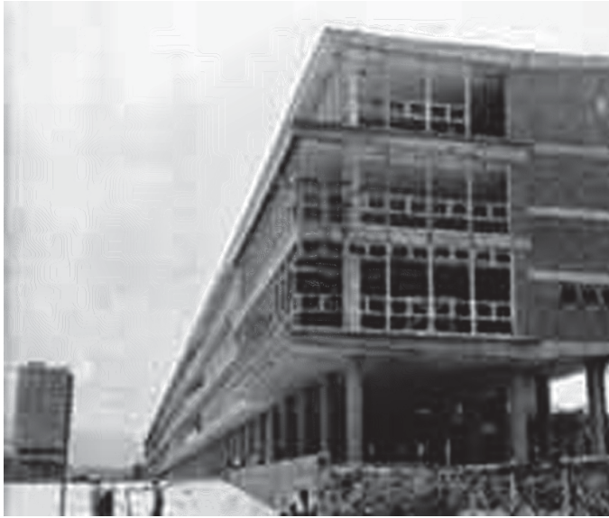
Estructura del edificio que albergó inicialmente a la Facultad de Derecho (primer plano) y a la de Filosofía y Letras (al fondo).

cámaras.” 15 Asimismo participó en 1963, junto con destacados penalistas 16 , en el Proyecto de Código Penal Tipo . 17