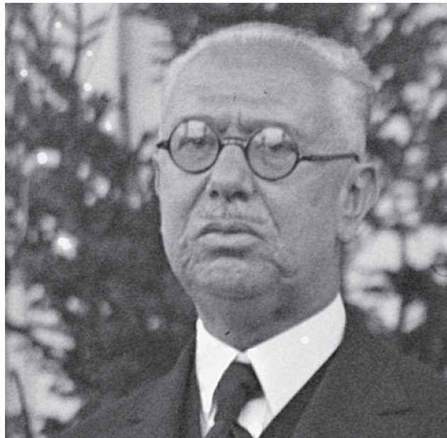
Ing. Pascual Ortiz Rubio, presidente de México entre 1930 y 1932.