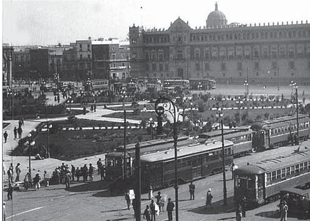
El zócalo en 1930.