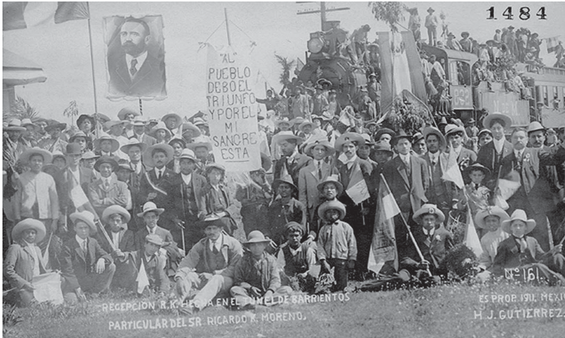
Partidarios de Francisco I Madero