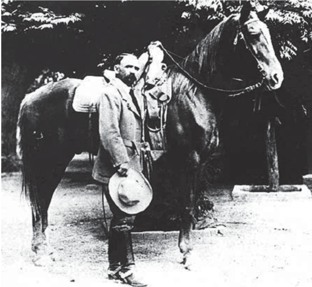
Fotografía de Francisco I. Madero.

4 Este hecho se refiere en la obra del estadounidense John Keneth Turner, México Bárbaro, en la cual se aborda tanto la situación de los indios en Yucatán, como el exilio de los indios yaquis del norte del país en esa región donde fueron tratados como esclavos, cf al respecto la obra citada, especialmente en los dos primeros capítulos, hay una versión electrónica en: http://www.benemerito.edu.mx/files/otros/mexicobarbaro.pdf