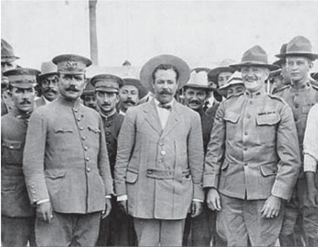
Álvaro Obregón y Francisco Villa.

poseer bienes raíces, se les hacía carecer también de personalidad jurídica para defender sus derechos, y por otra parte, resultaba enteramente ilusoria la protección que la ley de terrenos baldíos, vigente, quiso otorgarles al facultar a los síndicos de los ayuntamientos de las municipalidades para reclamar y defender los bienes comunales en las cuestiones que esos bienes se confundiesen con los baldíos, ya que, por regla general, los síndicos nunca se ocuparon de cumplir esa misión, tanto por que les faltaba interés que los excitase a obrar, como porque los jefes políticos y los gobernadores de los Estados estuvieron casi siempre interesados en que se consumasen las explotaciones de los terrenos de que se trata;