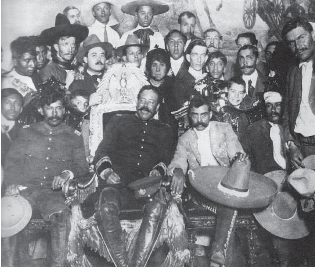
Emblemática fotografía de Francisco Villa (sentado en la silla presidencial) y Emiliano Zapata.

segundo del caudillo don Francisco I. Madero, y en caso de que no acepte este delicado puesto, se reconocerá como jefe de la Revolución al C. general don Emiliano Zapata.