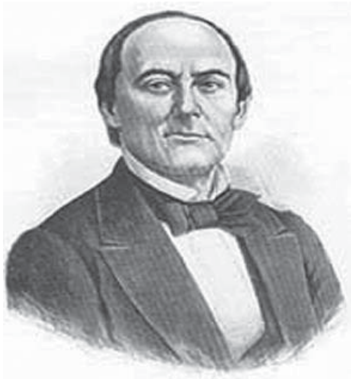
Sebastián Lerdo de Tejada.