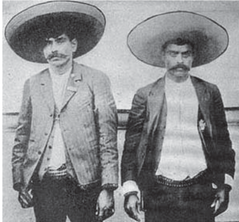
Eufemio y Emiliano Zapata.

Los llamados rurales o sea las fuerzas del orden que cuidaban los caminos cometieron toda clase de injusticias colgando en los árboles que lindaban con los caminos a los bandoleros o presuntos bandoleros de cualquier tipo sin juicio ni remotamente sumario. La aparente paz que prevalecía en el Porfiriato era como dicen “la paz de los sepulcros” y favoreció a la oligarquía, a la alta burguesía, pero sólo trajo a los trabajadores de la tierra más injusticia de la que habían soportado durante siglos.