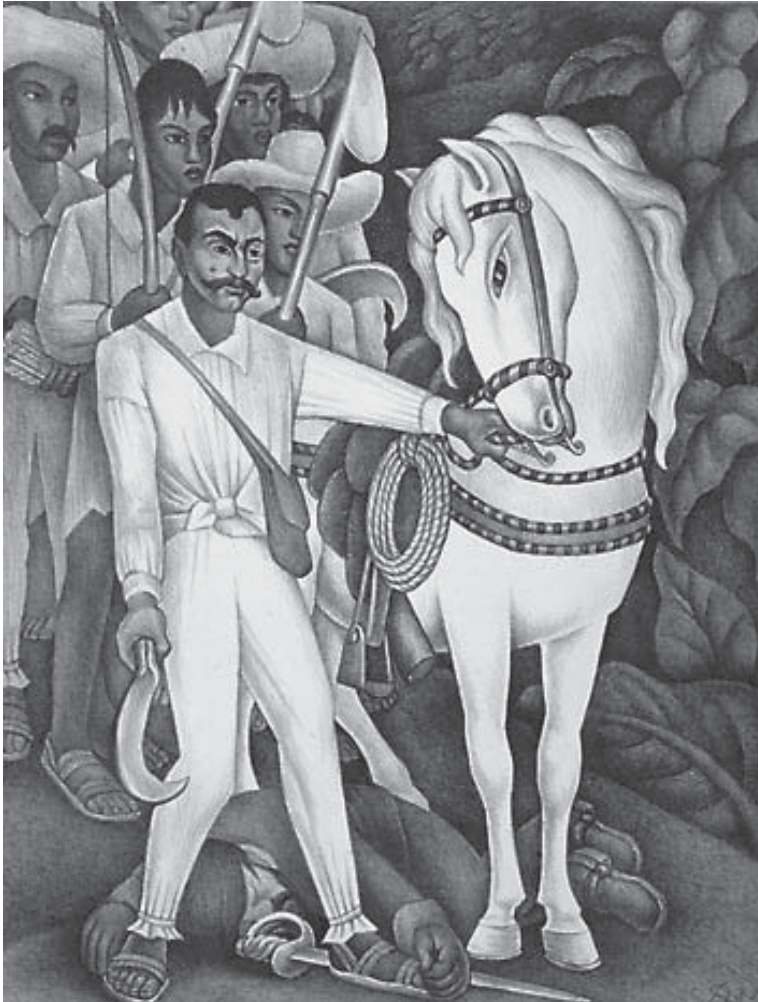
Emiliano Zapata en un mural de Diego Rivera.

Francisco Ignacio Madero estaba alejado de la realidad mexicana después de muchos años de estudio en el extranjero, cuando regresó a México sólo consideró dos temas básicos para lograr la felicidad del Pueblo Mexicano la no reelección y el sufragio efectivo tal como lo plasmó en el Plan de San Luis de 1910 al que tuvo que agregarle el artículo 3° que era el clamor general o sea la restitución de las tierras, bosques y aguas despojados a los pueblos, un reclamo jurídico y de profundo contenido económico y social. Lo anterior para concurrir a las elecciones con un voto mayoritario y la legitimidad del electorado.