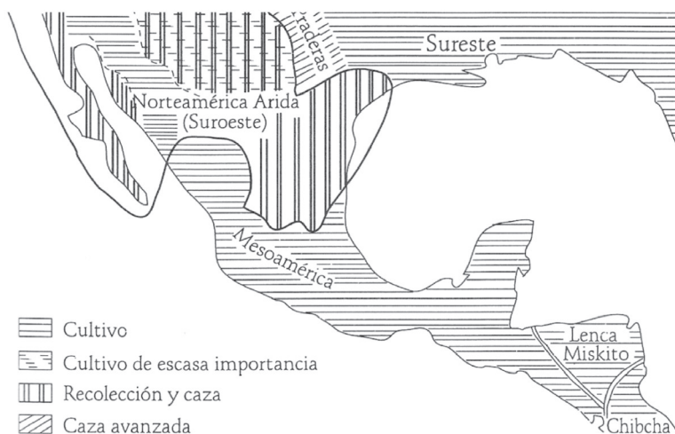
FIGURA 2. Mesoamérica y áreas circunvecinas (Kirchhoff, 1960).