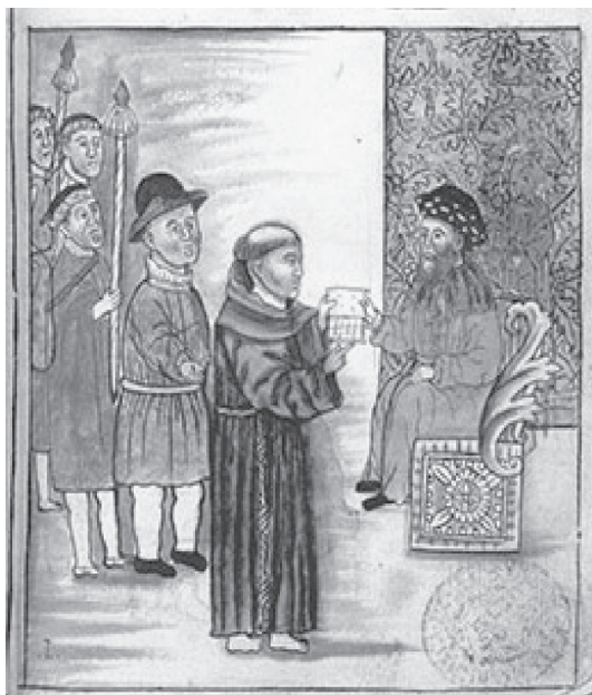
FIGURA 3. Entrega de la Relación de Michoacán , lámina I.

Una hipótesis acerca de la autoría de esta obra se basa en que no es realizada por una única mano, debido a que se trata de una tarea colegiada, como se muestra en la imagen, hecha por los principales de la comunidad, la élite sobreviviente a la conquista y la casta sacerdotal que se mantiene resistiendo y conviviendo con la fuerza evangelizadora de los frailes, que terminarán imponiendo un sincretismo cristiano. Así, se postula que fray Jerónimo de Alcalá fue el compilador de estos esfuerzos.