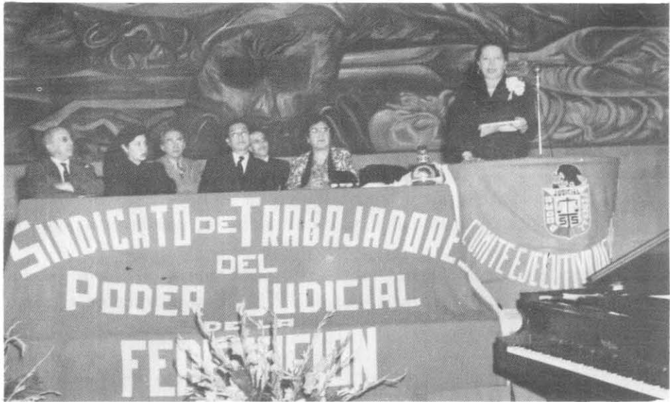
"Las leyes reconocerán como un derecho de los obreros y de los patronos, las huelgas y los paros." (art. 123, fracc. XVII)