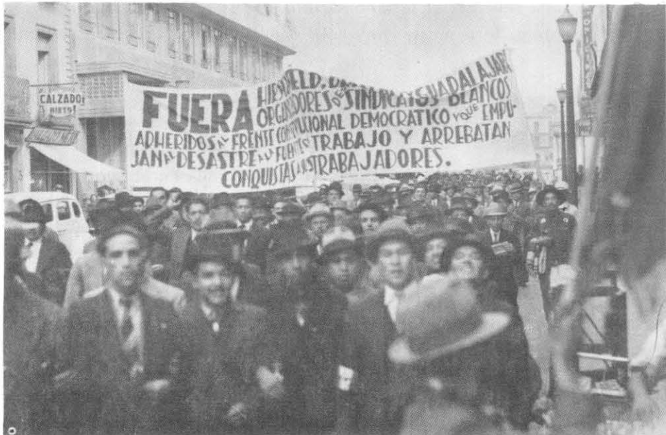
"Las huelgas serán lícitas cuando tengan por objeto conseguir el equilibrio entre los diversos factores de la producción, armonizando los derechos del trabajo con los del capital." (art. 123, fracc. XVIII)