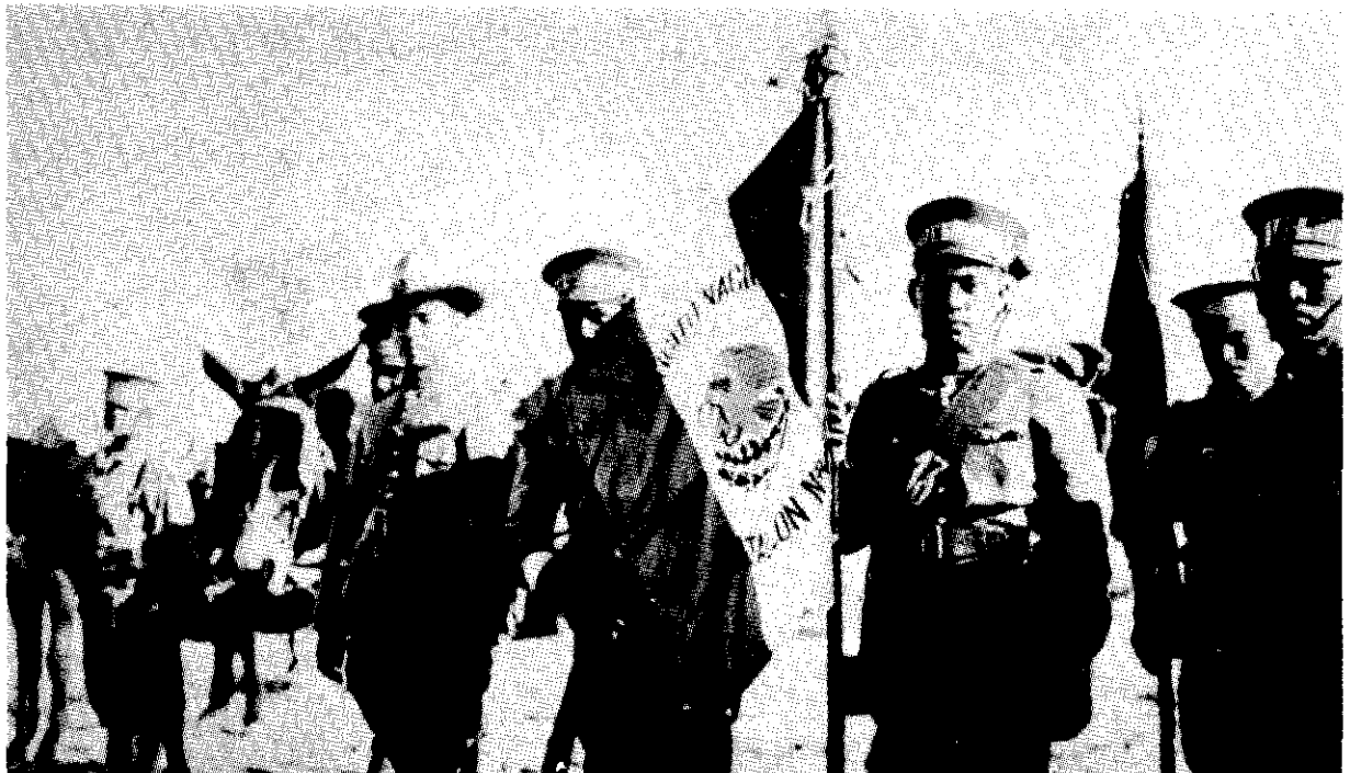
El Ejército Nacional.