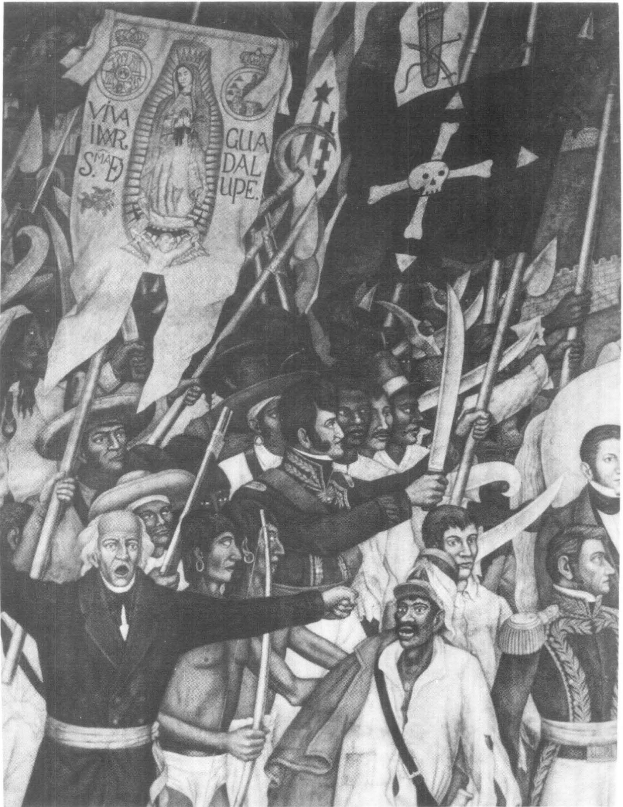
Fragmento del mural Retablo de la Independencia (1960-1961) de Juan O'Gorman, que se encuentra en el Museo Nacional de Historia del Castillo de Chapultepec.