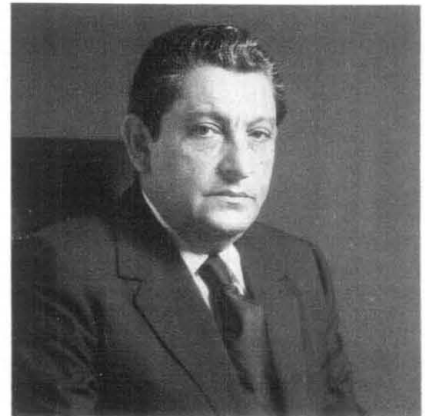
Sen. Salvador J. Neme Castillo. Secretario de la Gran Comisión del Senado de la República.