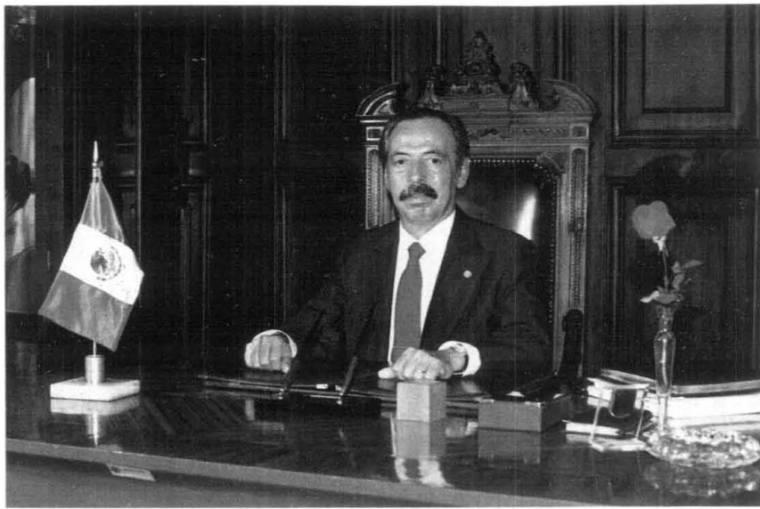
Sen. Antonio Riva Palacio López. Presidente de la Gran Comisión del Senado de la República.