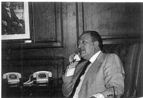
Lic. Miguel Montes García. Oficial Mayor del Senado de la República.