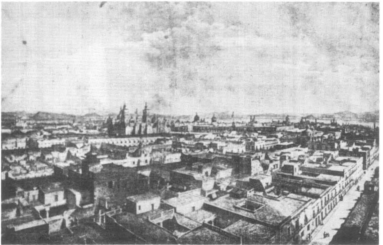
Vista panorámica de la ciudad de México, desde San Agustín.