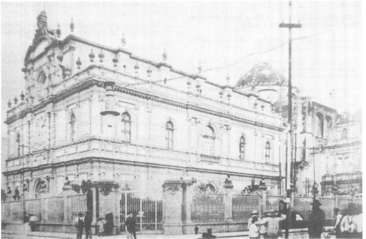
Antiguo Templo de San Agustín.