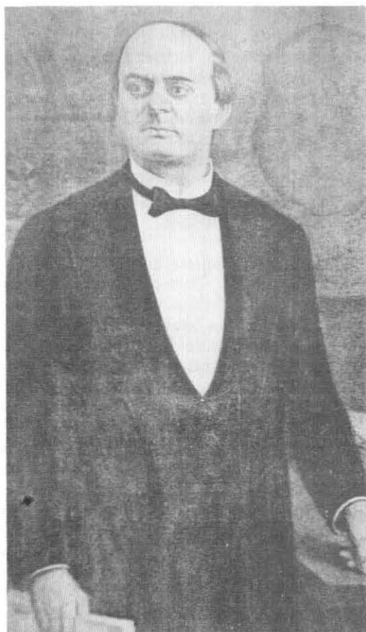
Sebastián Lerdo de Tejada.

Sin embargo, históricamente la necesidad de ratificar un tratado ha constituido, en casos extremos, la salvaguarda política y constitucional de tratados firmados por presiones diplomáticas hacia México. Carrillo Flores cita que en el caso de los llamados Tratados de Bucareli, de 1923 y de la Conferencia de Bogotá en 1948, en los que por grandes presiones de los representantes de Estados Unidos, México se vio obligado a signar convenciones contrarias a los principios constitucionales, por lo que "el Senado tiene una función preventiva que puede ser trascendental en horas difíciles," 23 y podría ser el último recurso de derecho interno para negar su validez.