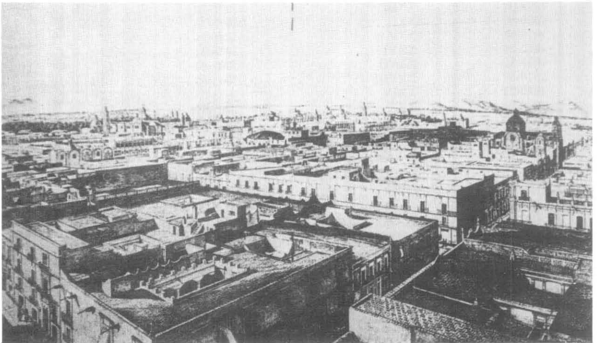
Perspectiva de la ciudad de México, Litografía de Casimiro Castro.