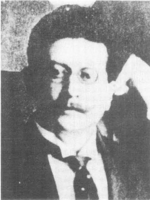
Ricardo Flores Magón.