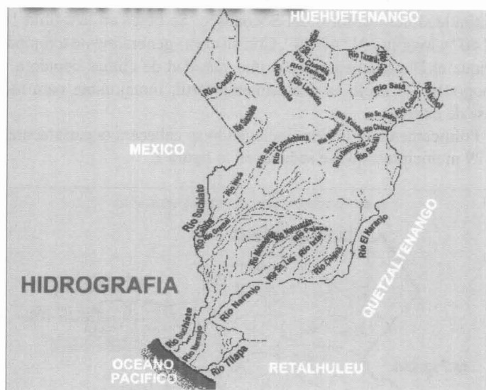
Figura 2. Hidrografía del Departamento de San Marcos. INE, 2001.

tierras por varios ríos, siendo los más importantes el Suchiate, el Cabuz, el Naranjo, el Nahuatan, el Tilapa, el Meléndrez, el Coatlán, el Cuilco, etcétera.