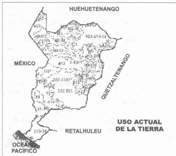
Figura 9. Uso de la tierra (INE 2001)

La figura 9 muestra el uso actual de la tierra en el Departamento, de acuerdo a la siguiente nomenclatura (INE, 2001):