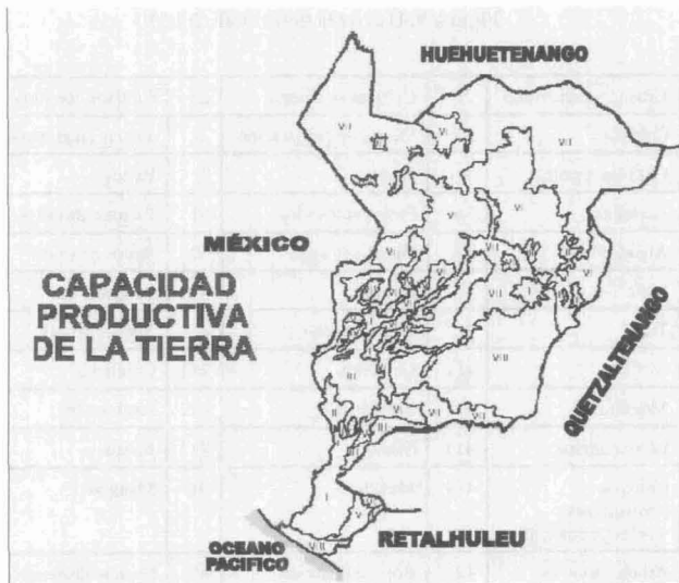
Fig. 8. Capacidad productiva de la tierra en el Departamento de San Marcos

VIII. Tierras no aptas para el cultivo, aptas sólo para parques nacionales, recreación y vida silvestre y para protección de cuencas hidrográficas, con topografía muy quebrada, escarpada o playones inundables.