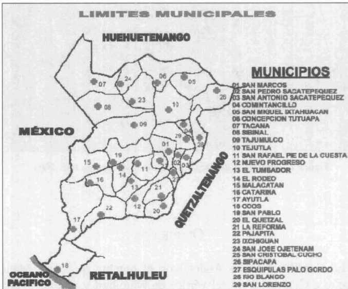
Figura 1. Municipios que componen el Departamento de San Marcos, Guatemala. INE. 2001.

Políticamente se divide (incluyendo su cabecera departamental), en 29 municipios, que se señalan en la figura 1.