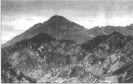
Figura 3. El volcán Tacaná.