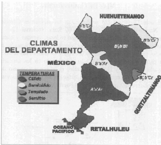
Figura 5. Climas presentes en el Departamento de San Marcos, Guatemala.