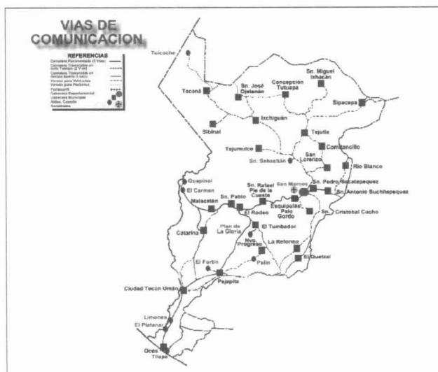
Figura 6. Vías de comunicación en el Departamento de San Marcos. INE, 2001

En este Departamento se localizan las siguientes Carreteras: Ruta Nacional 1, Ruta Nacional 6-W, Ruta Nacional 12-S y la Interamericana CA-2. También existen roderas, veredas y caminos vecinales, todos de terracería, que sirven de comunicación entre poblados vecinos. Existe además las vías y estaciones del ferrocarril en la parte fronteriza con México, sobre todo en los municipios de Ayutla, Pajapita y Ocos, las cuales quedaron en desuso desde hace más de dos décadas. Este Departamento tiene además vías de comunicación marítimas a través del Puerto de Ocos.