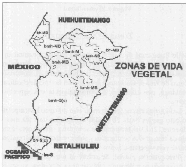
Figura 4. Zonas de vida en el Departamento de San Marcos. INE, 2001.