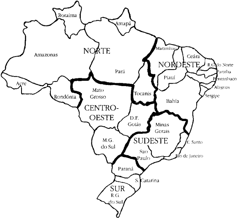
Figura 1: República Federal de Brasil