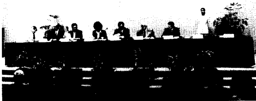
Mesa inaugural del Foro para la Discusión de las Plataformas Electorales de los Partidos Políticos y Coaliciones.

FORO PARA LA DISCUSION DE LAS PLATAFORMAS ELECTORALES DE LOS PARTIDOS POLITICOS Y COALICIONES