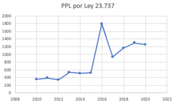
Gráfico 1. Crecimiento de la población penitenciaria detenida por drogas