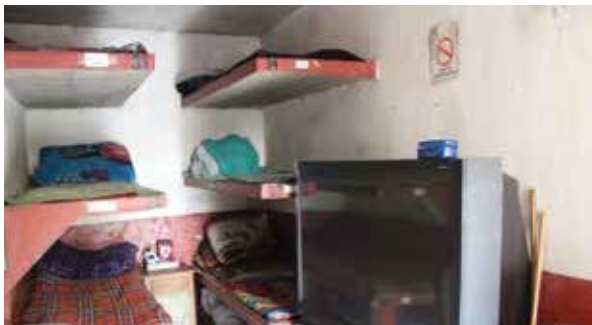
Dormitorio del Centro Aprendiendo a Vivir en Cristo, A.C.

derechos humanos de las personas albergadas, desde su ingreso y durante el tiempo que permanecen en dicho lugar ( Anexo 12 ).