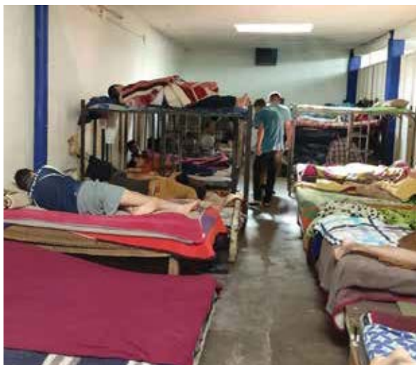
Dormitorio del Grupo de Alcohólicos Anónimos Bloke de Occidente, A.C.