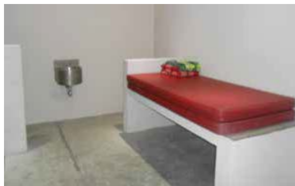
Celda de la Unidad de Acusación de Cadereyta de Montes, Querétaro.