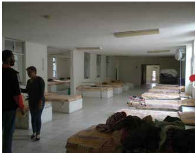
Dormitorio de Casa Hogar para Adultos Mayores "Doctor Nicolás Aguilar".