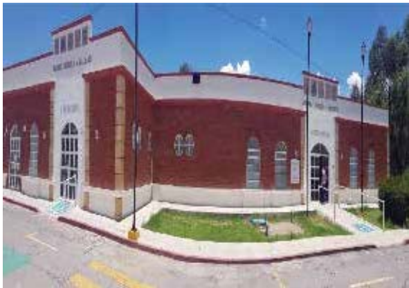
Hospital Psiquiátrico "Villa Ocaranza", Tolcayuca, Hidalgo.