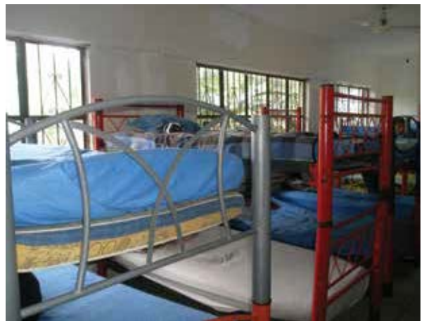
Dormitorio del Centro Bill y Bob, A.C.