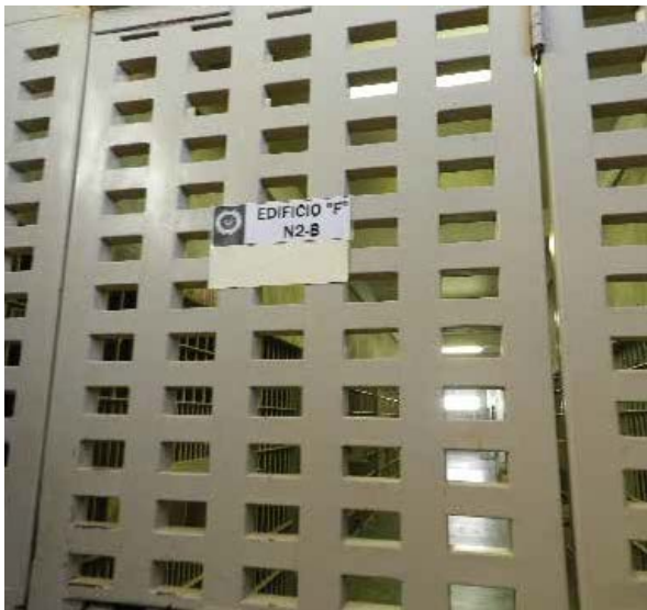
Sección de Medidas Especiales (a la sazón "El Hongo 3").