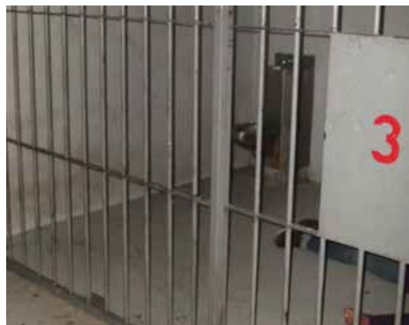
Área de Aseguramiento del Centro Integral de Procuración de Justicia del Estado de Sonora.

persona es detenida, hasta el momento en que es presentada ante un juez o es liberada. Las salvaguardias que se deben respetar en favor de las personas detenidas son las siguientes: 1. El Derecho a que se notifique a terceros sobre su custodia policial. 2. El Derecho a acceder a un/a abogado/a. 3. El Derecho a que se le realice un examen médico (incluso por un médico independiente) dentro de las 12 horas de su detención. 4. El Derecho a recibir información sobre sus derechos ( Anexo 16 ).