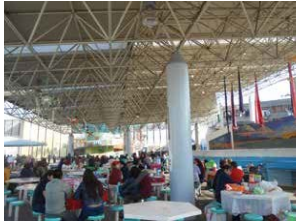
Área de Visita del Centro Femenil de Reinserción Social “Santa Martha Acatitla”.