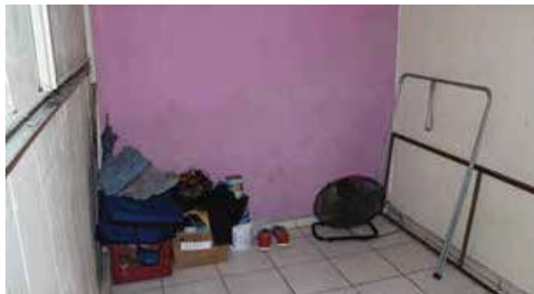
Área médica del Centro de Rehabilitación Jóvenes Mazatlán una Oportunidad de Vida, A.C.