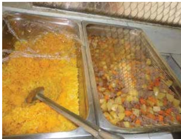
Alimentos que se reparten en la Estación Migratoria de la Ciudad de México “Las Agujas”.