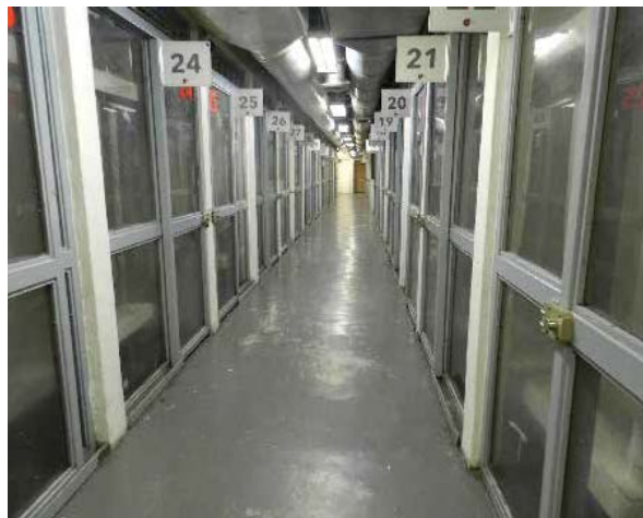
Galeras de la Unidad de Investigación de Homicidios Intencionales, en Guadalajara, Jalisco.

Estado de Jalisco, dos Centros de Atención Integral a la Salud Mental, que dependen de la Secretaría de Salud Estatal y siete Instituciones Privadas de Asistencia Social, todas en el Estado de Jalisco, personal del Mecanismo Nacional, durante mayo de 2019 llevó a cabo visitas de seguimiento a dichos lugares ( Anexo 22 ).