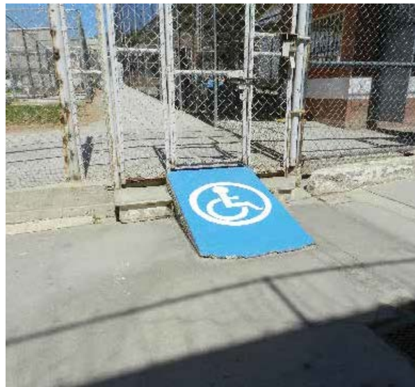
Rampas de acceso del Centro de Reinserción Social de Ensenada.