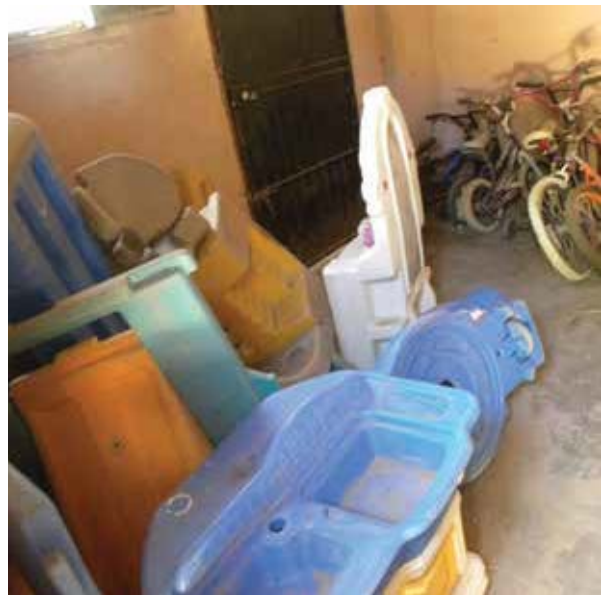
Bodega de la Casa Hogar Maria Niña, A.C.