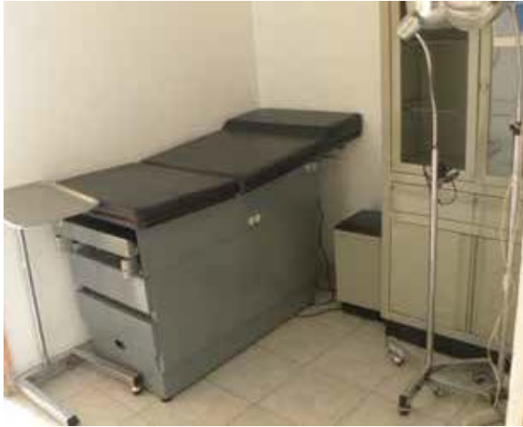
Área médica de la Delegación Estatal de la Fiscalía General de la República en San Luis Potosí.