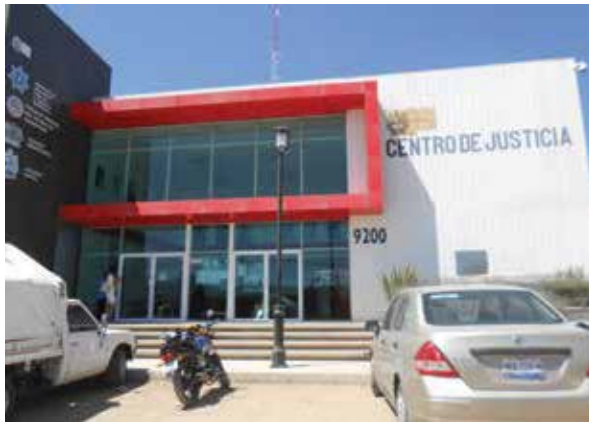
Separos de Seguridad Pública Municipal de Colón, en Querétaro.

Ezequiel Montes, Huimilpan, Pedro Escobedo, San Juan del Río, Santiago de Querétaro, Tequisquiapan y Tolimán, todos en el Estado de Querétaro, durante abril de 2019, personal del Mecanismo Nacional llevó a cabo visitas de seguimiento a los mencionados lugares ( Anexo20 ).