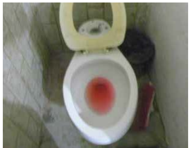
Área de Aseguramiento de la Fiscalía General de Justicia de Acapulco, Guerrero.