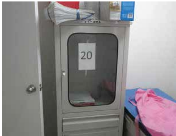
Área médica del Centro de Justicia Valle de Chalco.