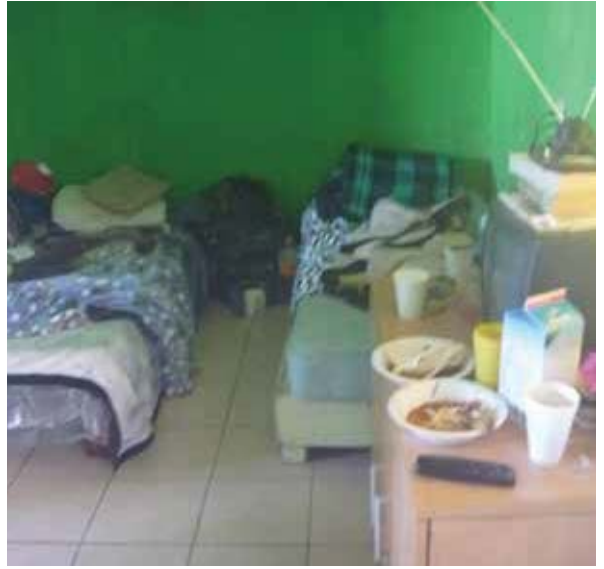
Dormitorios de la Casa para Ancianos "El Refugio", A.C.