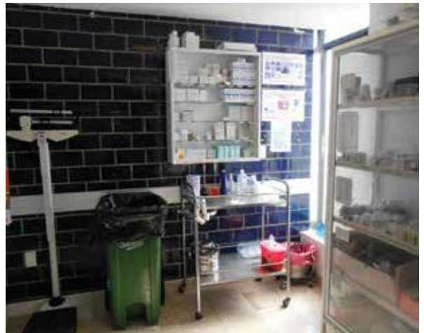
Área médica del Centro Femenil de Reinserción Social “Santa Martha Acatitla”.