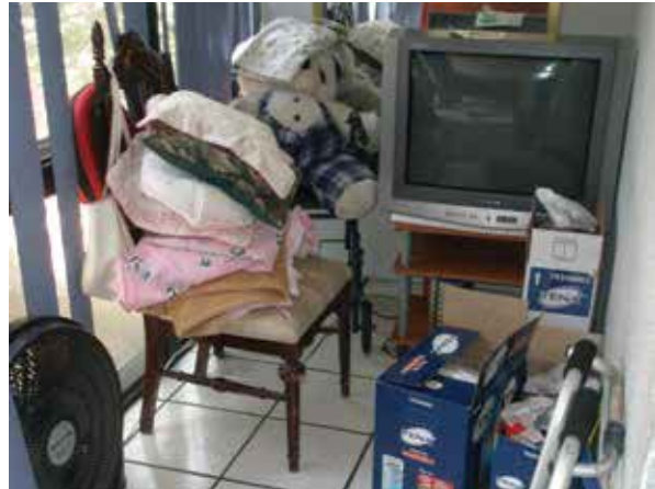
Recamara de Casa Hogar para Adultos Mayores "Feliz Atardecer".