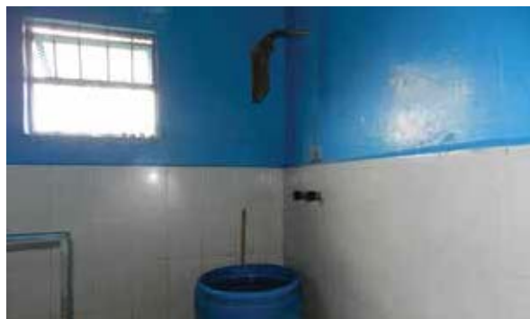
Baño del Centro de Recuperación para Alcohólicos y Drogadictos Anónimos (La Providencia).