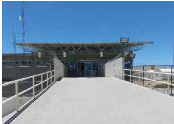
Centro de Reinserción Social "El Hongo 2".