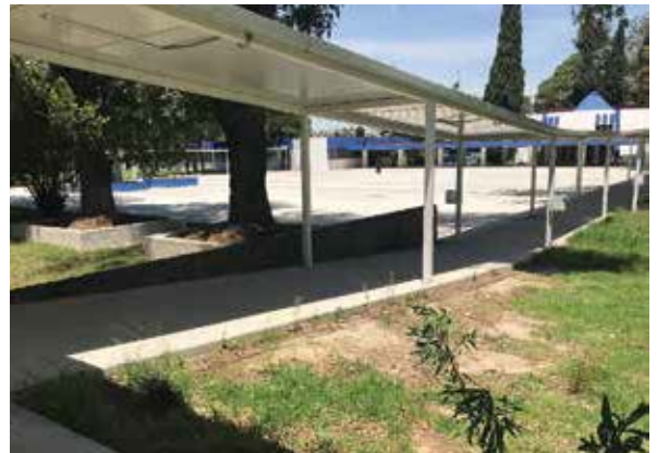
Rampas de acceso en el Hospital Psiquiátrico "Dr. Rafael Serrano", Puebla.