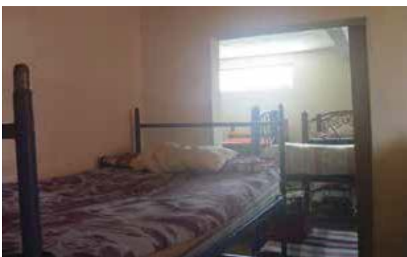
Dormitorio de la Casa de Rehabilitación Femenil Soledad Valencia, A.C.

los derechos humanos de las personas albergadas, desde su ingreso y durante el tiempo que permanecen en dicho lugar ( Anexo 13 ).