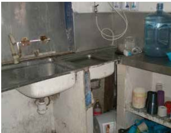
Cocina del Centro Cristo, A.C.

derechos humanos de las personas albergadas, desde su ingreso y durante el tiempo que permanecen en dicho lugar ( Anexo 8 ).