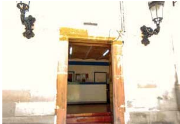
Registro de entrega de alimentos de la Comisaría de Seguridad Pública Municipal de Atotonilco El Alto, Jalisco.