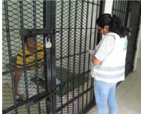
Área de Aseguramiento de la Fiscalía General de Justicia de Campeche.