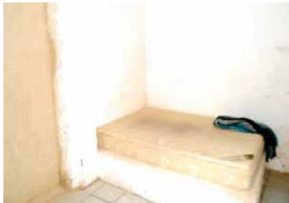
Área médica de la Comisaría de Seguridad Pública Municipal de Tepatitlán de Morelos, Jalisco.