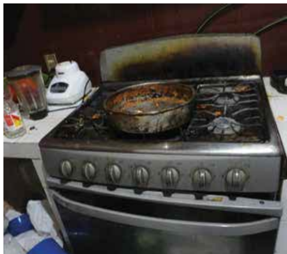
Preparación de Alimentos del Centro de Recuperación y Rehabilitación para Enfermos de Alcoholismo y Drogadicción del Pacífico, A.C. (CREAD).