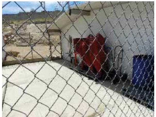
Lugar donde se realiza la visita familiar del Centro de Internamiento para Adolescentes en Ensenada, Baja California.