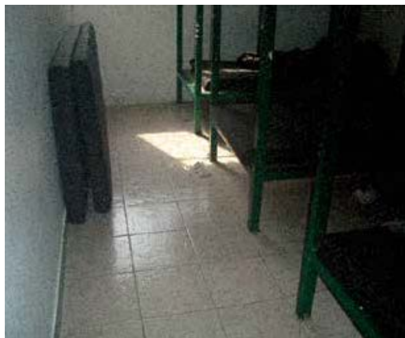
Dormitorios de la Estación Migratoria de la Ciudad de México “Las Agujas”.