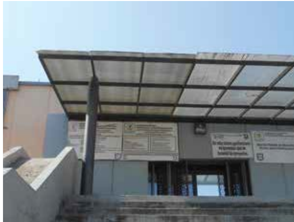
Centro Femenil de Reinserción Social “Santa Martha Acatitla”.

Martha Acatitla”, en la Ciudad de México, personal de dicho Mecanismo Nacional, durante enero de 2019, llevó a cabo una visita de seguimiento a dicho Centro Femenil ( Anexo 18 ).