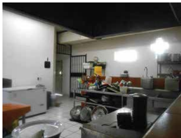
Cocina del Centro Ave Fenix 2000, A.C.