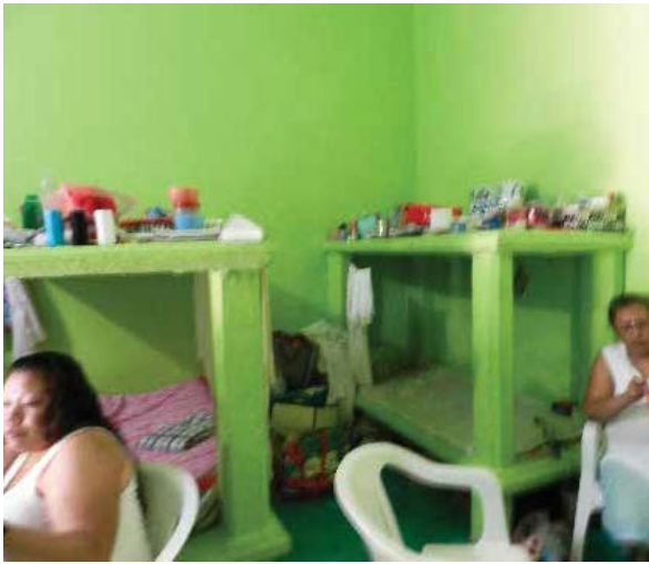
Dormitorio Femenil del Centro de Reinserción Social Distrital Acatlán de Osorio, en el Estado de Puebla.