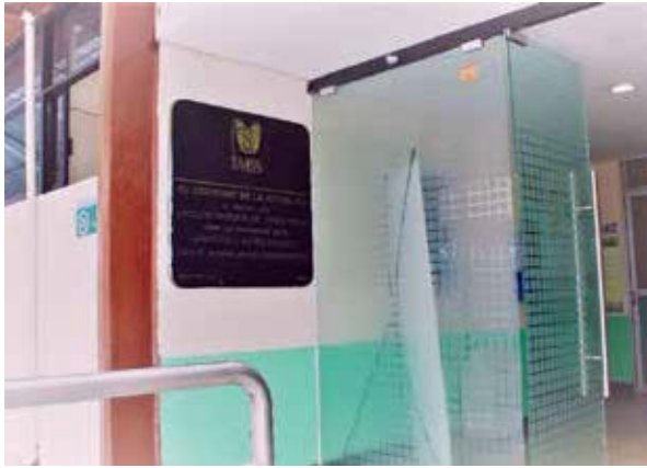
Unidad Médica Complementaria de Alta Especialidad "Hospital de Psiquiatría Morelos" (IMSS).