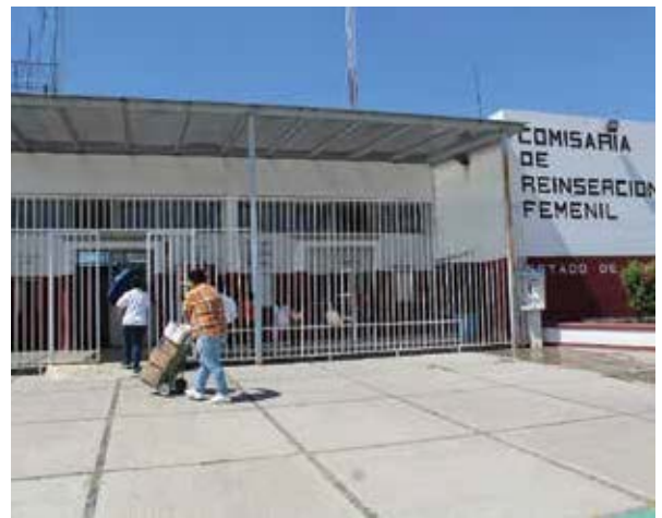
Comisaría de Reinserción Femenil del Estado de Jalisco.