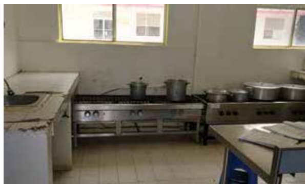
Área de Cocina y Comedor del Centro de Asistencia e Integración Social Coruña Jóvenes.

respeto a los derechos humanos de las personas albergadas, desde su ingreso y durante el tiempo que permanecen en dicho lugar ( Anexo 15 ).