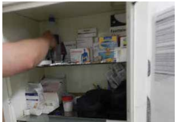
Medicamentos y material de curación del área médica del Juzgado Cívico Municipal "Delegación Epigmenio González Flores" de Santiago de Querétaro.