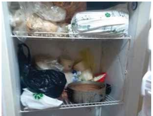
Cocina del Centro Agua Viva Mujeres, A.C.