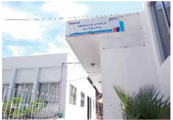
Juzgado Cívico Municipal el Marqués, Querétaro.