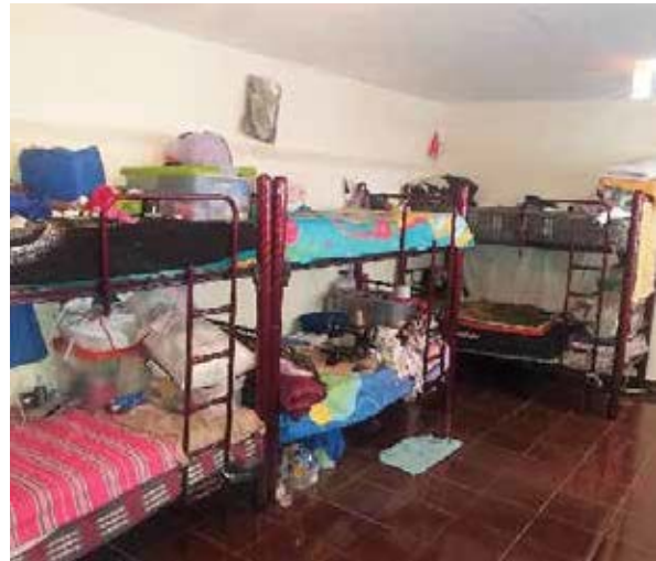
Dormitorio Femenil del Centro de Reinserción Social Distrital de Tepeaca, Puebla.