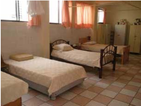
Dormitorio de Casa Hogar para Adultos Mayores "Ignacio Montes de Oca".