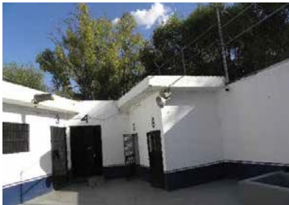
Celdas del Juzgado Cívico Municipal de San Juan del Río, Querétaro.