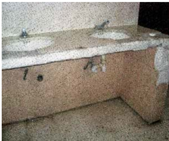
Servicios sanitarios de la Estación Migratoria de la Ciudad de México “Las Agujas”.