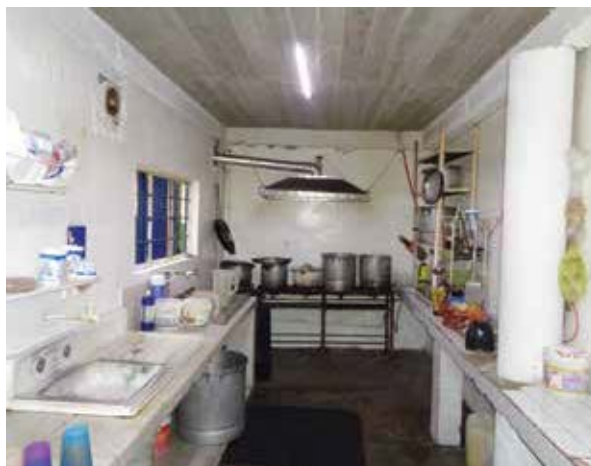
Cocina y almacén de la Fundación 10 de Junio.