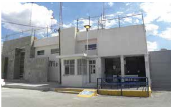
Centro Penitenciario CP3 Varonil, San Juan del Río, en Querétaro.