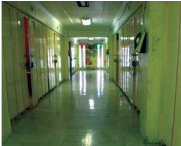
Comedor de estancias del Centro Femenil de Reinserción Social “Santa Martha Acatitla”.