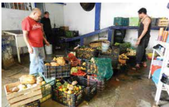
Almacén del Centro Portal del Cielo, A.C.