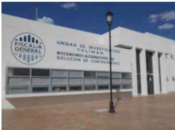
Unidades de Investigación y Acusación del Distrito Judicial de Toluimán, Querétaro.

Gobierno del Poder Ejecutivo del Estado de Querétaro; la Casa Hogar de Protección Infantil “Carmelita Ballesteros”, que depende del Sistema Estatal para el Desarrollo Integral de la Familia (D.I.F.) y cuatro Instituciones Privadas de Asistencia Social, todas en el Estado de Querétaro, personal de dicho Mecanismo Nacional, durante el mes de abril de 2019, llevó a cabo una visita de seguimiento a dichos lugares ( Anexo19 ).