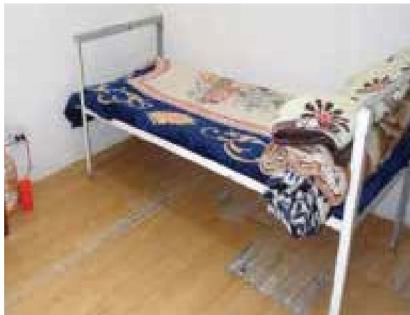
Dormitorio para personas adolescentes del sexo femenino del Centro de Internamiento para Adolescentes en Ensenada, Baja California.

fornia, dependiente de la Secretaría de Seguridad Pública del Estado de Baja California, personal adscrito al Mecanismo Nacional de Prevención, durante julio de 2019, llevó a cabo una visita de seguimiento a dicho lugar ( Anexo 26 ).