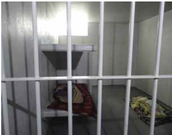
Área de Detención del Centro de Justicia Valle de Chalco.

nar, desde su ingreso y durante el tiempo que permanecen las personas detenidas, el respeto a sus derechos humanos ( Anexo 17 ).