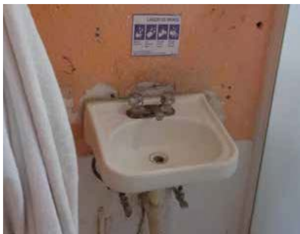
Baño de la Fundación Quinta Santa María Centros de Recuperación, A.C.

derechos humanos de las personas albergadas, desde su ingreso y durante el tiempo que permanecen en dicho lugar ( Anexo 9 ).