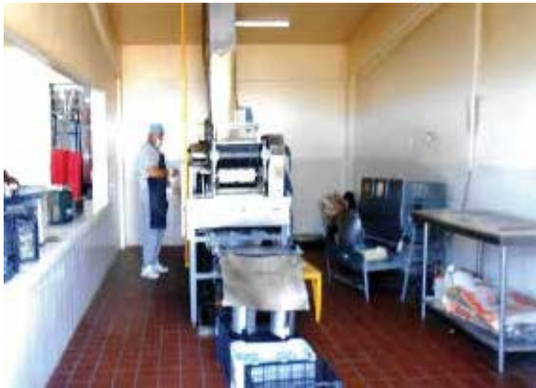
Área de cocina del Centro de Reinserción Social "El Hongo".

todos bajo la competencia de la Secretaría de Seguridad Pública del Estado de Baja California, personal de dicho Mecanismo Nacional, durante julio de 2019, realizó visitas de seguimiento a dichos lugares ( Anexo 25 ).