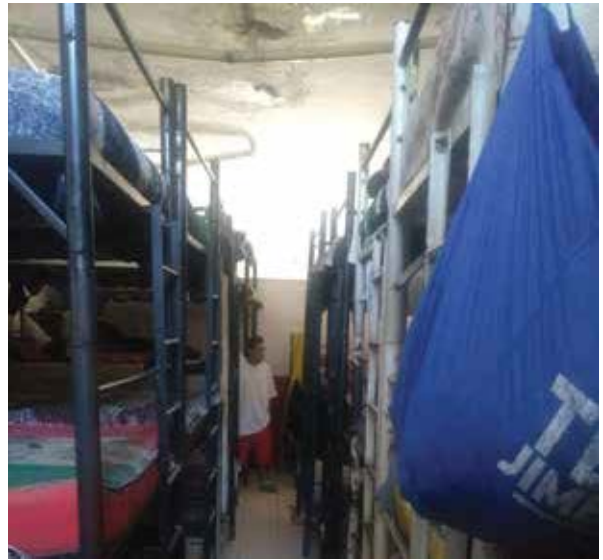
Dormitorio del Centro Nueva Generación 2 de Junio, A.C.