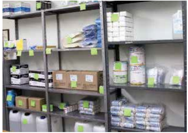
Farmacia de la Granja Psiquiátrica de Parras de La Fuente.