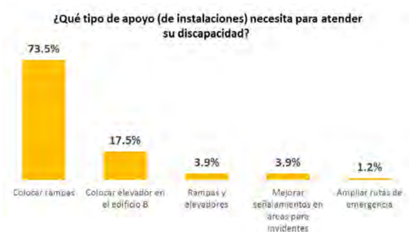
Gráfica 3. Tipo de infraestructura que reportaron los alumnos para mejoras en el CELE. Nota: Del total de la población que contestó el cuestionario, 257 opinaron sobre los apoyos adicionales que se necesitan realizar en el CELE.

Al desglosar la información por lengua, los estudiantes de francés son lo que presentan algún tipo de discapacidad con mayor porcentaje, seguidos de los de inglés y portugués, tal y como se puede apreciar en la gráfica 2.