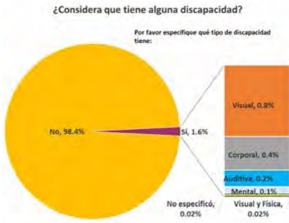
Gráfica 1. Porcentajes de las respuesta hacia la pregunta del cuestionario “¿Considera que tiene alguna discapacidad?”

A continuación les mostramos los resultados: del total de participantes, 54.2% fueron mujeres y 45.8% hombres. La mayoría (78.6%) tiene entre 18 y 25 años. Más del 85% son estudiantes de licenciatura y 9.3% de maestría. Sólo 2.1% de los que contestaron el cuestionario tiene dificultad para ver, es decir, respondieron sólo ver sombras aun cuando utiliza gafas o lentes. La mayoría respondió que no tiene dificultad para ver las letras de un texto, aunque 21.8% tiene dificultad moderada. Con lo que respecta al problema de sordera,