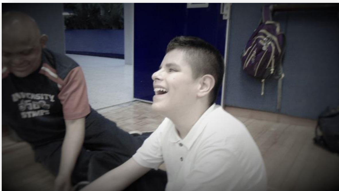
Figura 2. “Alumno de la Facultad de Música”

Desde la creación del proyecto, la convocatoria ha estado abierta a alumnos que deseen ingresar a estudiar una de las carreras en la Facultad.