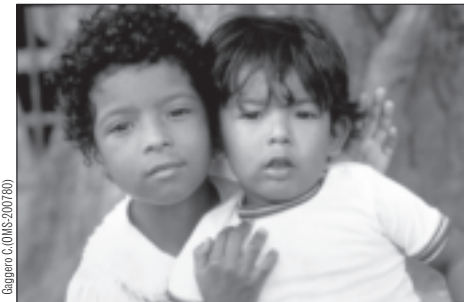
Diapero C (01/MS/2007/80)

colaboración con redes y organizaciones ya existentes, la creación de grupos de discusión sencillos pero bien organizados, la organización de entrevistas y la celebración de reuniones en salas comunales. Para organizar un proceso participativo eficaz es preciso contar con tiempo suficiente. En muchos países, el periodo de partici-