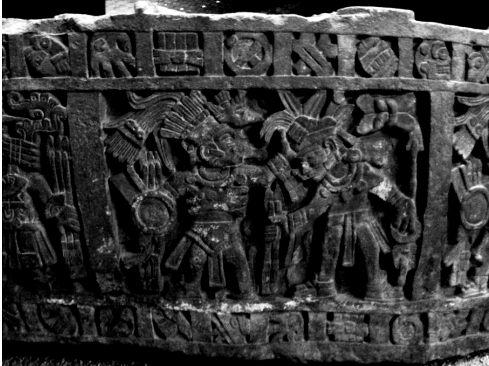
Figura 3. Conquista de Cuetlaxtlan en el Temalacatl Cuauhxicalli de Moctezuma I. MNA.

tributo, y aunque puedan haber practicado el cultivo y otras artes para su propio sustento, desde el punto de vista de la organización imperial se deben considerar como especialistas en guerra.