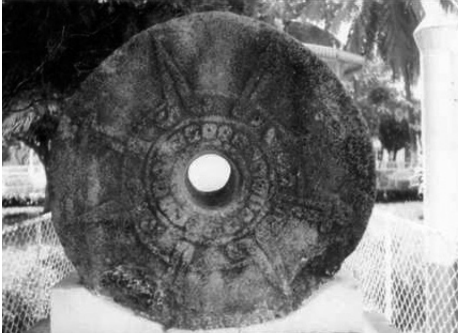
Figura 4. Disco solar procedente de Cuetlaxtlan.

Por la riqueza de sus productos y su ubicación de acceso al mar, sus productos y quizá las rutas marítimas de intercambio comercial en la Costa del Golfo, representó un territorio estratégico codiciado por otros grupos étnicos y políticos.