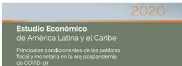
Estudio Económico de América Latina y el Caribe 2020 Economic Survey of Latin America and the Caribbean 2020

También disponibles para años anteriores/ Issues for previous years also available