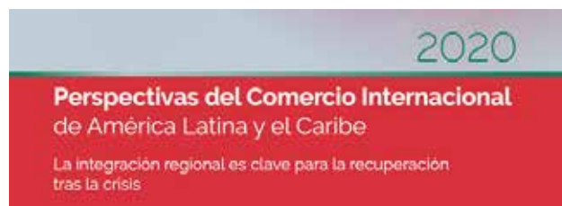
Perspectivas del Comercio Internacional de América Latina y el Caribe 2020 International Trade Outlook for Latin America and the Caribbean 2020