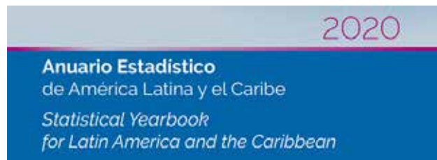
Anuario Estadístico de América Latina y el Caribe 2020 Statistical Yearbook for Latin America and the Caribbean 2020