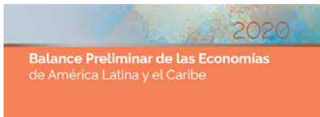
Balance Preliminar de las Economías de América Latina y el Caribe 2020 Preliminary Overview of the Economies of Latin America and the Caribbean 2020