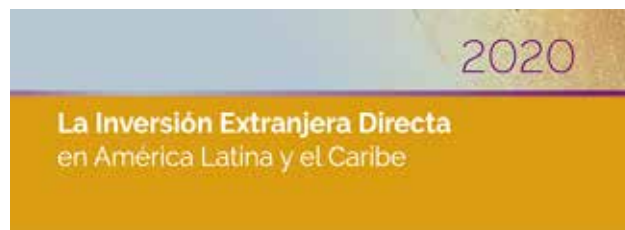
La Inversión Extranjera Directa en América Latina y el Caribe 2020 Foreign Direct Investment in Latin America and the Caribbean 2020