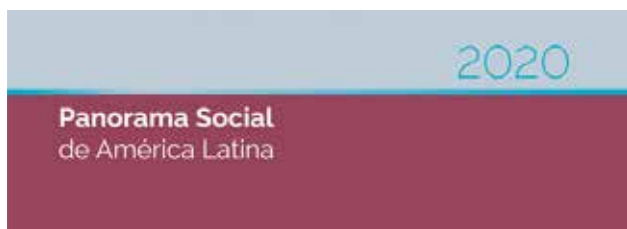
Panorama Social de América Latina 2020 Social Panorama of Latin America 2020