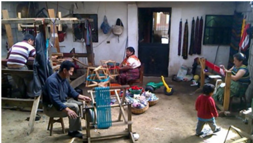
Taller familiar de tejidos y telares mayas en Chuatroj, Totonicapán, Guatemala, 2015.

“Chuatroj laboran en Estados Unidos. La temporalidad de estancia varía de 1 mes hasta 11 años de vivir en ese país. El 97.7% de todos los que se encuentran en Estados Unidos no cuentan con permisos para trabajar en ese país. El 56% de todas las personas que radican en Estados Unidos se ubican en la ciudad de Houston en el Estado de Texas, le sigue en importancia la ciudad de Miami, Florida y el Estado de Carolina del Norte, el resto están distribuidos en diferentes ciudades de diferentes Estados”, (Dardón, 2015:48).