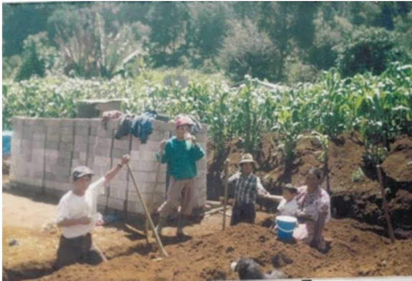
Construcción de una casa con ingresos provenientes de las remesas migrantes.

La participación con la comunidad en cine-foros, actividades festivas y culturales me permitió conocer algunos aspectos de su experiencia migrante, deseo subrayar que la metodología y los criterios bajo los cuales se llevaron a cabo las actividades del cine foro fueron producto de un rico debate entre pensar con que film se podría inducir a hablar el tema de la migración considerando que la comunidad ha sufrido violencias de diversa índole entre las que subrayamos: desaparición de personas, fragmentación familiar a causa de la ausencia de alguno de los padres, pérdida del patrimonio cuando no se logra tener éxito, pues los viajes se financian muchas veces hipotecando las casas y las cuerdas de terreno que son la forma de sustento para las familias.