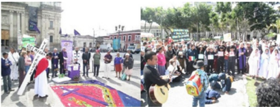
Viacrucis migrante, Parque Central, Ciudad de Guatemala, 2015.

Así, por ejemplo podemos señalar algunas actividades que enmarcan la presencia de la migración ilegalizada y sus consecuencias humanas, tal es el caso del viacrucis migrante que se realiza en vísperas de semana santa, es un performance público celebrado en el parque central de la ciudad de Guatemala, organizado por la iglesia católica y organizaciones de la sociedad civil que promueven el ejercicio de los derechos humanos de las personas migrantes, este evento hace alusión al dolor, sufrimiento e injusticia de la realidad migrante centroamericana violentada por las formas en las cuales este proceso se está llevando a cabo.