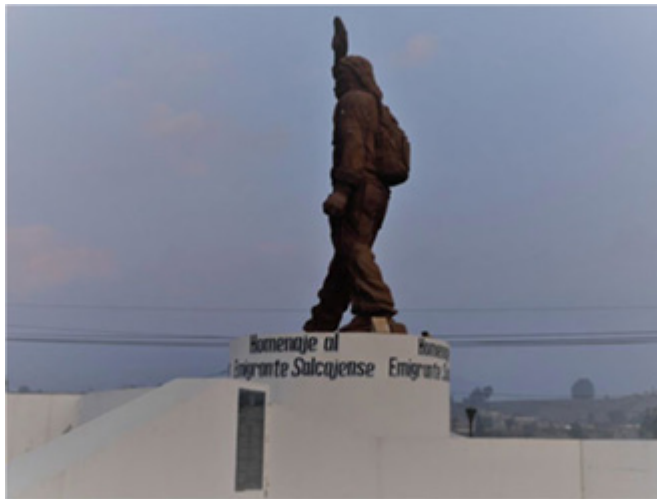
Monumento al migrante, Salcajá, Quetzaltenango, Guatemala, 2016.

Indiscutiblemente nos encontramos en una región con una considerable trayectoria histórica migratoria, este dato es muy importante, puesto que las migraciones étnico-rurales se desarrollan de igual manera en el contexto del mercado global norteamericano —que demanda un brazo laboral principalmente para su sector servicios—, tienen lógicas muy diferentes e inclusive prácticas más seguras respecto de las personas que migran solas, ya que estas están conformadas a partir de redes de parentesco y comunitarias, así como un saber histórico de la migración, señalando que pese a esa diferencia la migración sigue presentándose como una forma de violencia.