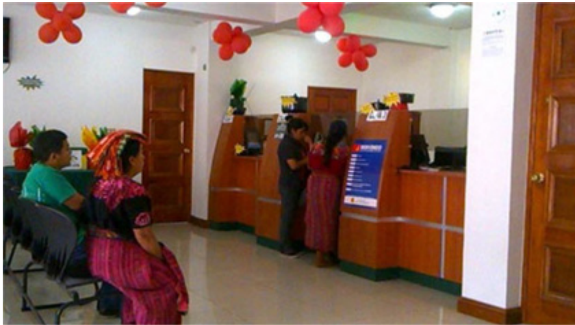
Mujeres K'iche' cobrando remesas en Chuatroj, Guatemala, 2015.

El objetivo principal de mostrar el análisis de la aldea haciendo énfasis en las referencias estadísticas que involucran a la migración es mostrar que la aldea de Chuatroj se encuentra bastante activa en lo que respecta a la migración hacia Estados Unidos, señalando que, si bien esta migración ha representado por un lado el avance hacia el desarrollo de familias y de la comunidad misma, por otro lado mantiene un ocultamiento de lo que ha implicado migrar desde la ilegalidad.