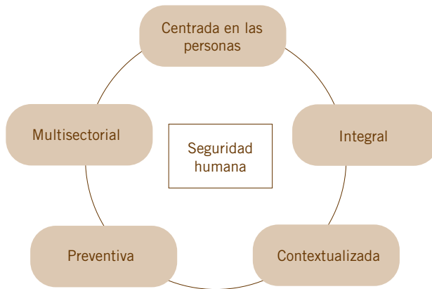
ESQUEMA 1. Características fundamentales de la seguridad humana