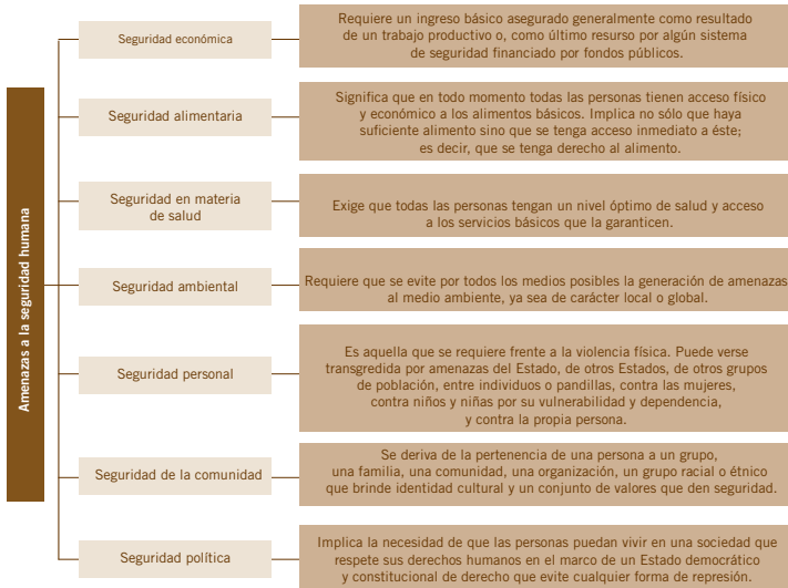
ESQUEMA 2. Aspectos de la seguridad que son afectados por las amenazas a la seguridad humana