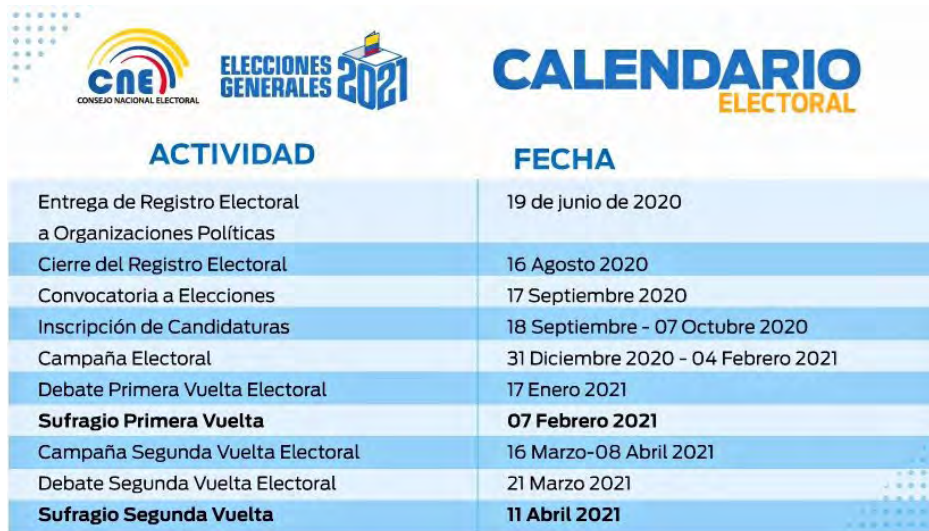
FIGURA 1. ELECCIONES GENERALES 2021/ CALENDARIO ELECTORAL.