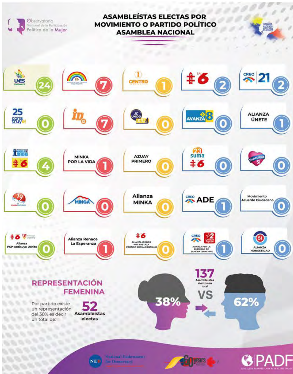
FIGURA 3. REPRESENTACIÓN FEMENINA POR ORGANIZACIÓN POLÍTICA