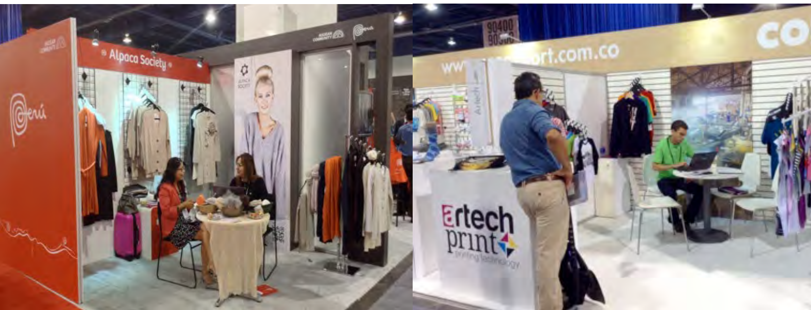
Participación de países andinos en Feria Magic 2014

Business Matchmaking Forum for Sourcing - Los Países Andinos contrataron a la empresa Graffiti Communications, con el fin de que las empresas asistentes participen en sesiones de Matchmaking durante 3 días con compañías americanas de Apparel. Cada empresa tuvo entre 5 y 8 citas agendadas con compradores compatibles con su oferta exportable y un total entre 60 y 80 de los principales fabricantes estadounidenses.