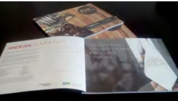
Publicación distribuida a potenciales compradores en FHC China 2013.

de las bondades de la oferta exportable andina presente en la Feria. Este documento se distribuyó a los potenciales compradores con el fin de que los visitantes tengan a la mano la información gráfica y en físico para futuros contactos y posibilidades de concretar negocios.