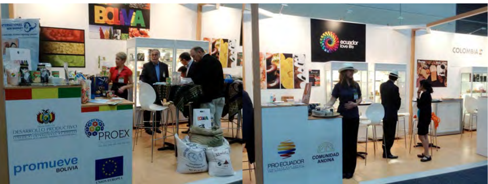
Feria Fine Food en Australia

Para esta participación, existió un financiamiento parcial de la CAF. La Secretaría General de la Comunidad Andina firmó para ello en mayo de 2013, un Convenio de Financiación No Reembolsable por USD 150,000 que permitió financiar parcialmente tanto la participación conjunta andina en esta Feria, así como la participación en la Feria FHC China, de la cual se hablará más adelante.