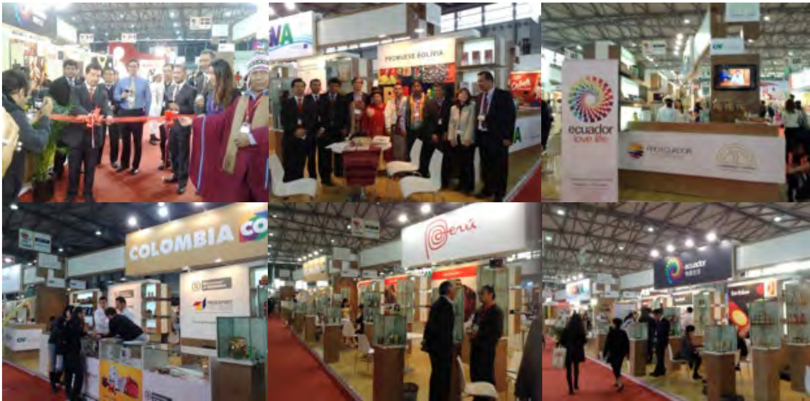
Pabellón Andino en la Feria FHC China 2013

Para el contacto con el empresario asiático, se dispuso la contratación de traductores quienes ayudaron comunicando las especificaciones de los productos en idioma chino mandarín e inglés para mayor entendimiento de los potenciales compradores.