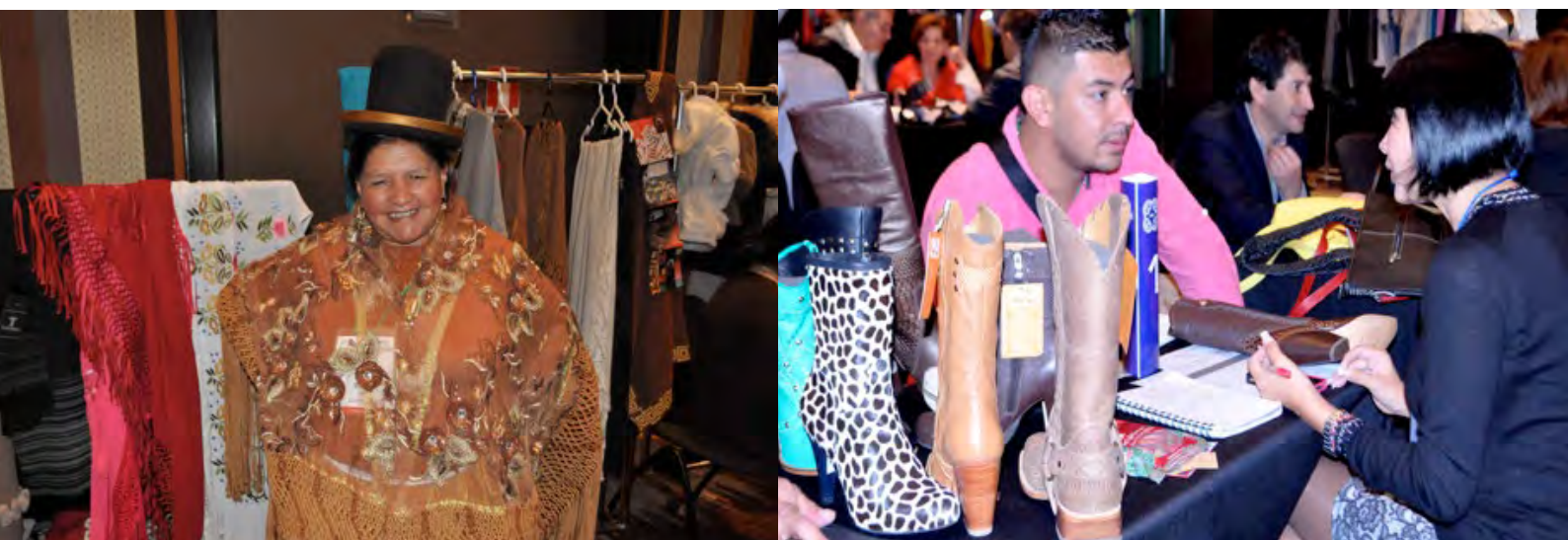
Encuentro Empresarial Andino 2014