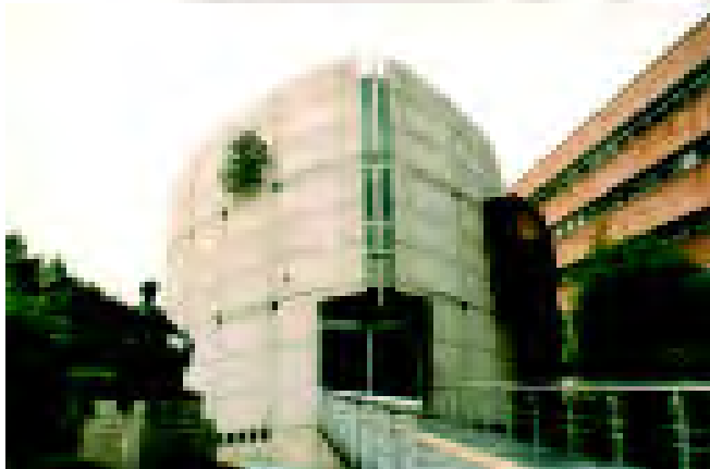
Salón de sesiones de la Sala Superior