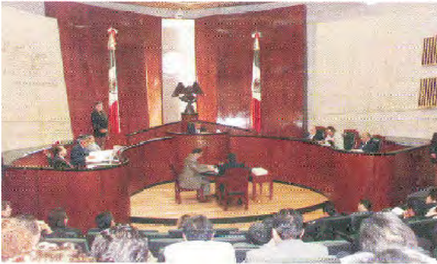
Sesión Pública de resolución

año 2000. Desde luego, es oportuno precisar que en las elecciones del 2003, se elegirán a los miembros de la Cámara de Diputados del Congreso de la Unión.