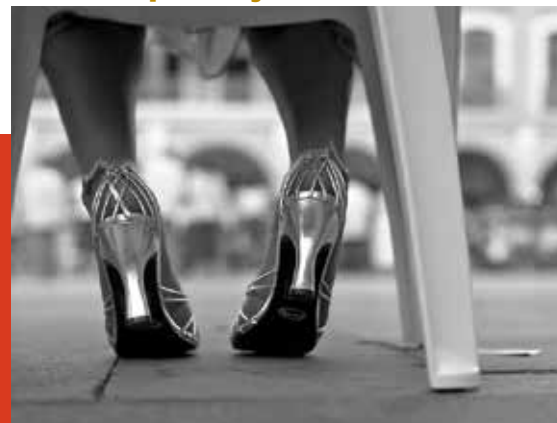
Bailes como el danzón manifiestan la importancia de Veracruz como parte de la cultura caribeña.

FUENTE: Raquel Torres Cerdán y Dora Elena Careaga Gutiérrez (comps.), Recetario afromestizo de Veracruz, México / Veracruz, Consejo Nacional para la Cultura y las Artes / Instituto Veracruzano de Cultura, 2000, p. 59.