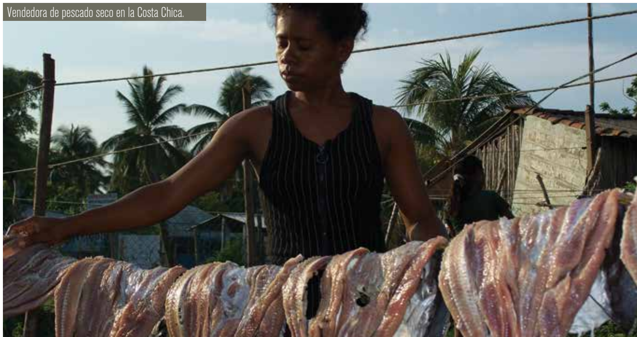
Vendedora de pescado seco en la Costa Chica.