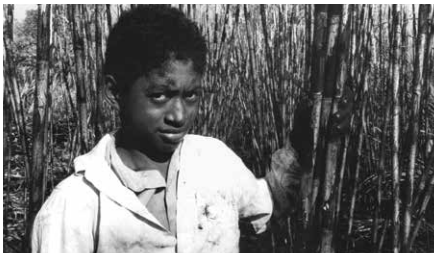
Africanos y afrodescendientes han desempeñado un papel central en el trabajo de la caña de azúcar, desde la época colonial hasta nuestros días, en regiones como Veracruz.