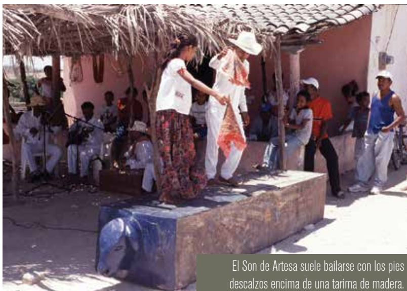
El Son de Artesa suele bailarse con los pies descalzos encima de una tarima de madera.

En la Costa Chica se identifican varias expresiones culturales recreadas a lo largo del tiempo por el intercambio y las transformaciones, que historiadores y antropólogos han considerado rasgos de origen africano. Es el caso del baile o fandango de artesa, que las parejas bailan descalzas sobre una tarima adornada con elementos zoomorfos, esto es, figuras