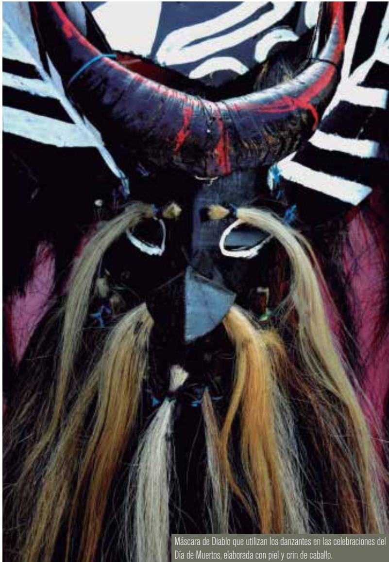
Máscara de Diablo que utilizan los danzantes en las celebraciones del Día de Muertos, elaborada con piel y crin de caballo.

Una de estas iniciativas fue la creación del primer museo en México sobre el tema, el Museo de las Culturas Afromestizas en Cuajinicuilapa, Guerrero, en 1995, el cual ha contribuido a que las comunidades de la Costa Chica conozcan su historia, sus orígenes y las características de sus manifestaciones culturales.