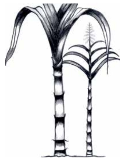
Caña de azúcar ( Saccharum officinarum ).

Además de la población afrodescendiente de origen colonial, en el siglo XIX Veracruz recibió, a través de compañías inglesas y francesas, a trabajadores libres de origen africano del ramo de la construcción. A principios del siglo XX, las compañías petroleras estadounidenses asentadas en esa zona también contrataron trabajadores afrodescendientes, muchos de ellos caribeños.