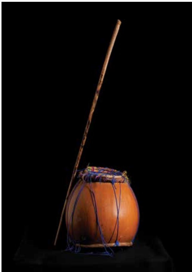
Bule, instrumento utilizado en la Danza de Diablos que produce sonidos que imitan los de algún animal.

que aluden a animales como el caballo o el ganado vacuno; en él se utilizan instrumentos musicales como el cajón, una percusión que se toca o golpea con las manos y palos. 3