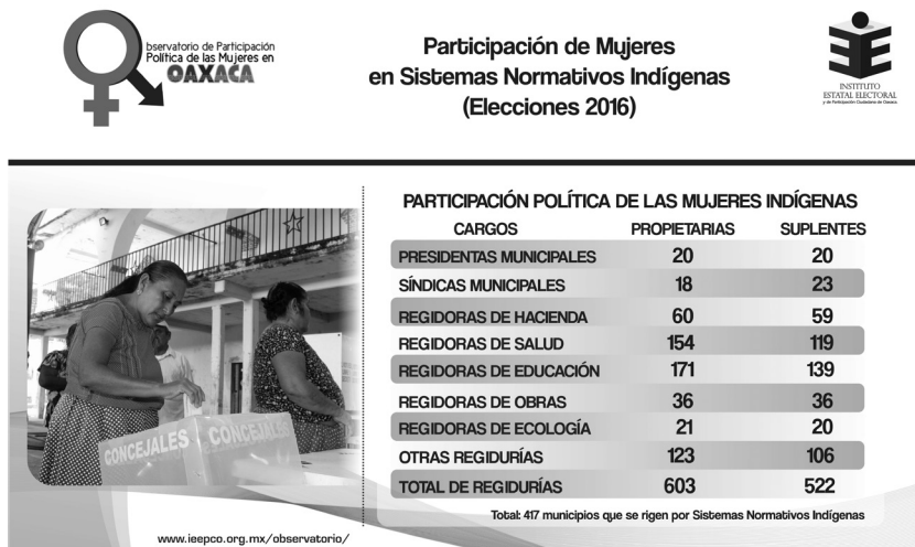
FIGURA 2. Resultados de mujeres electas en ayuntamientos de SNI en 2015-2016.

FUENTE: Dirección Ejecutiva de SNI del IEEPCO, resultados de mujeres electas en ayuntamientos de SNI en 2013, disponible en http://www.ieepco.org.mx/observatorio/sistemas-normativos-indigenas/resultados-elecciones-sistemas-normativos-indigenas-2016