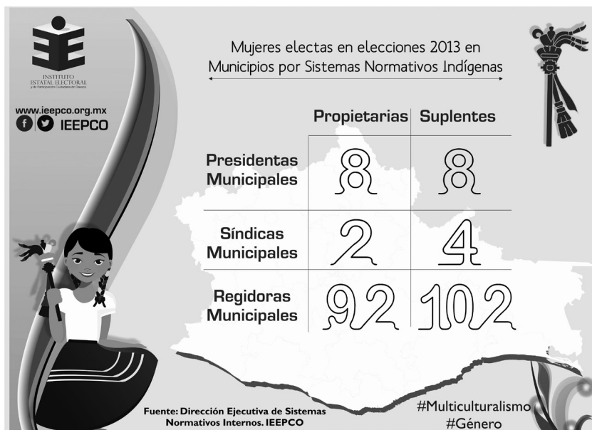
FIGURA 1. Resultados de mujeres electas en ayuntamientos de SNI