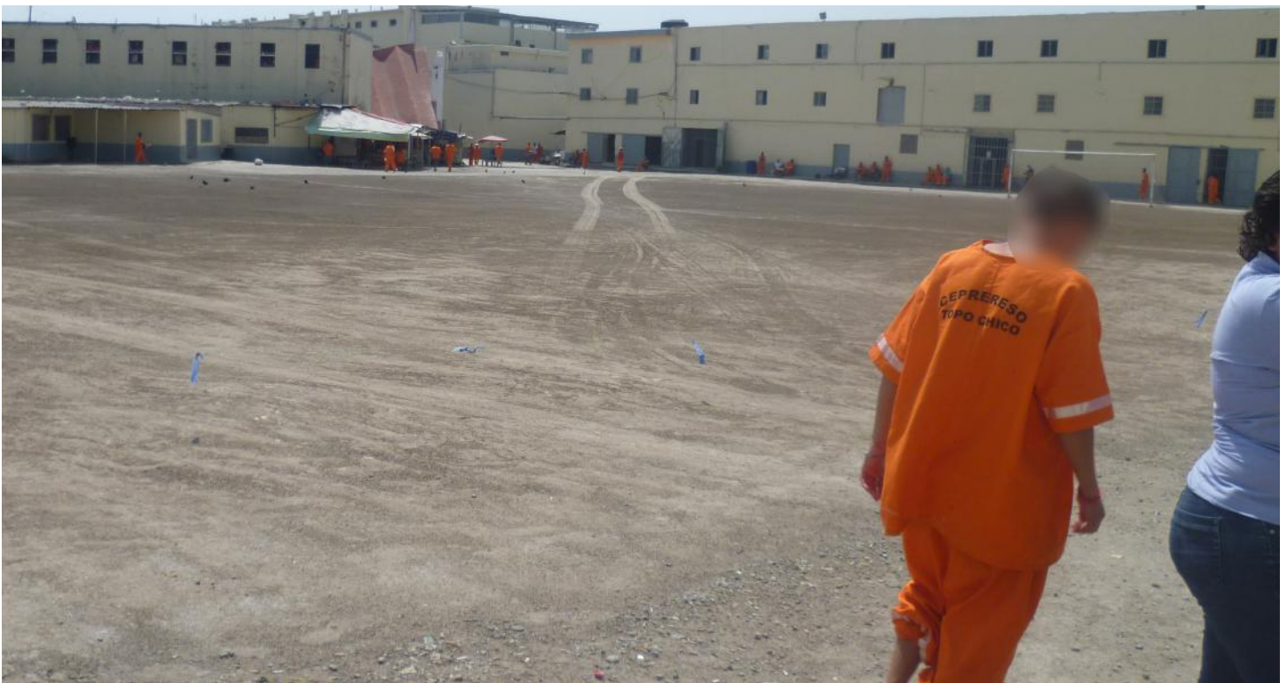
(28.5) No se observan actividades deportivas organizadas con regularidad.