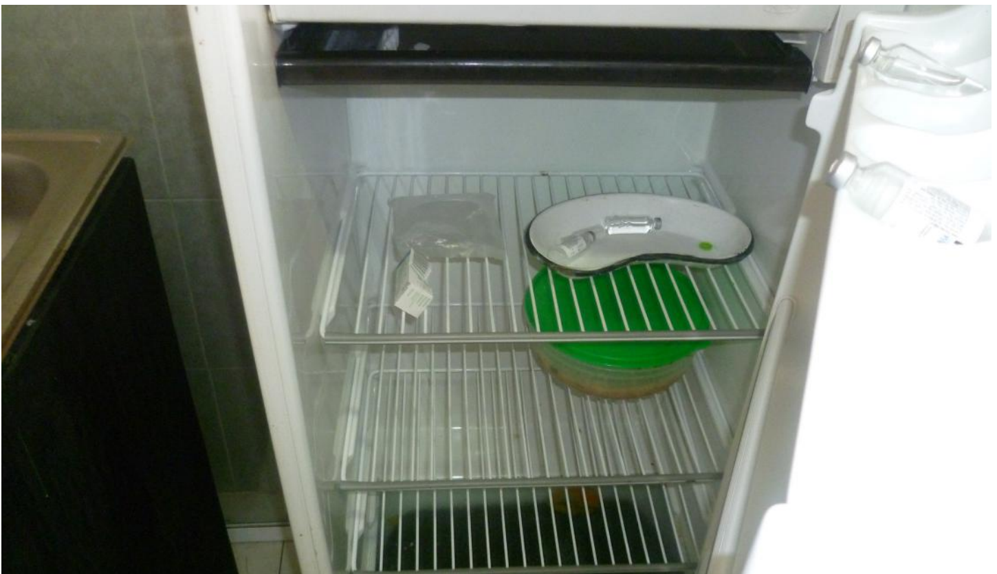
(22.1) Las referencias de desabasto se agudizan en el caso de aquellas enfermedades crónico-degenerativas.