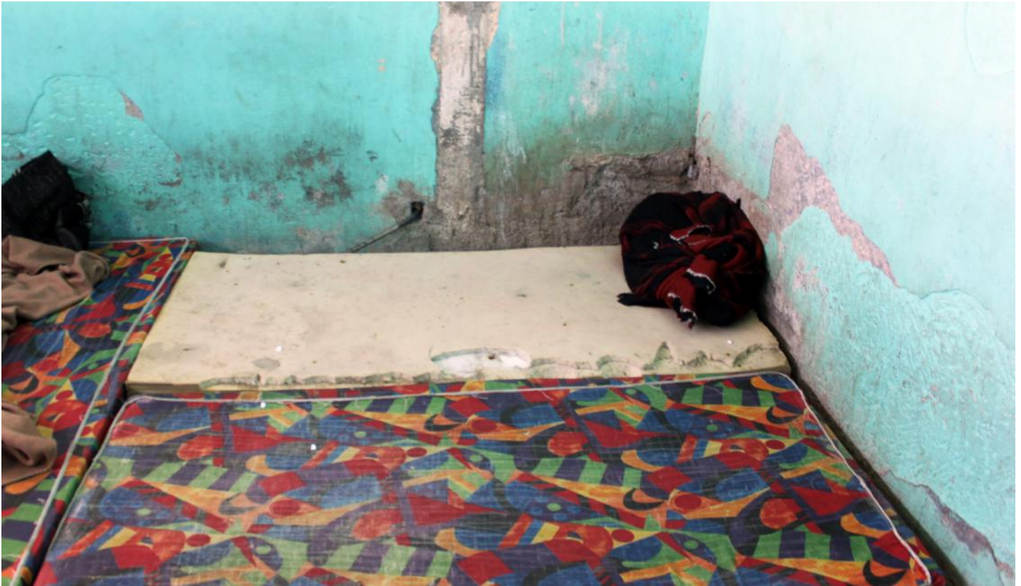
(13.1.) No existen camas suficientes; se observan múltiples colchones colocados en el piso.