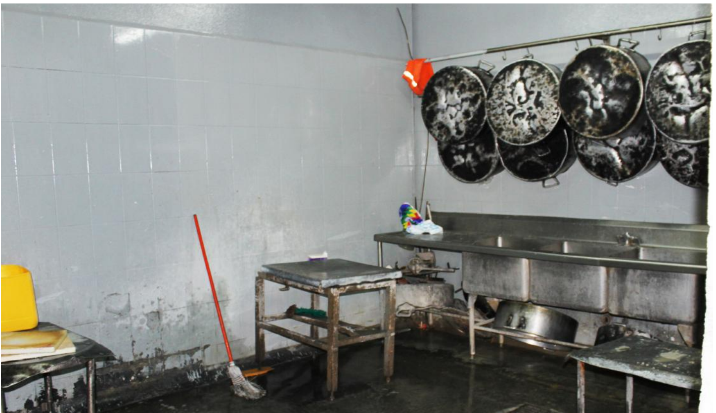
(18.) La higiene de los enseres de la cocina, es inconsistente.