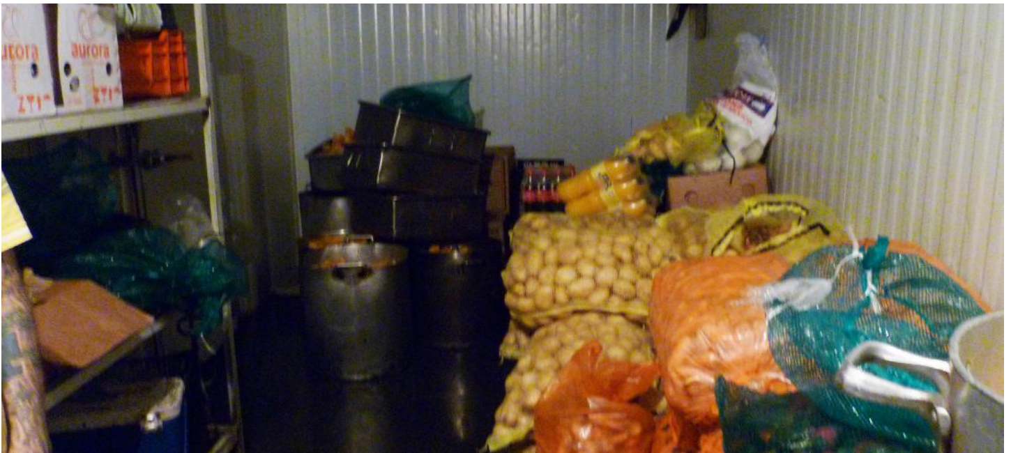
(17.) Hay deficiencias en la calidad y cantidad de las comidas que se reparten.