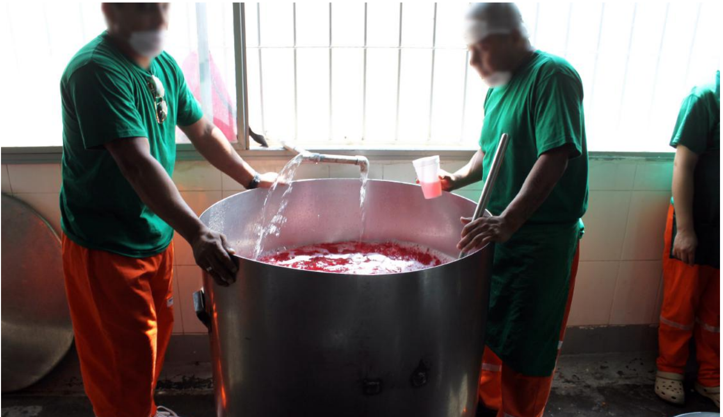
(18.) La higiene de las personas involucradas en los procesos de preparación de la comida y manipulación de alimentos es inconsistente.