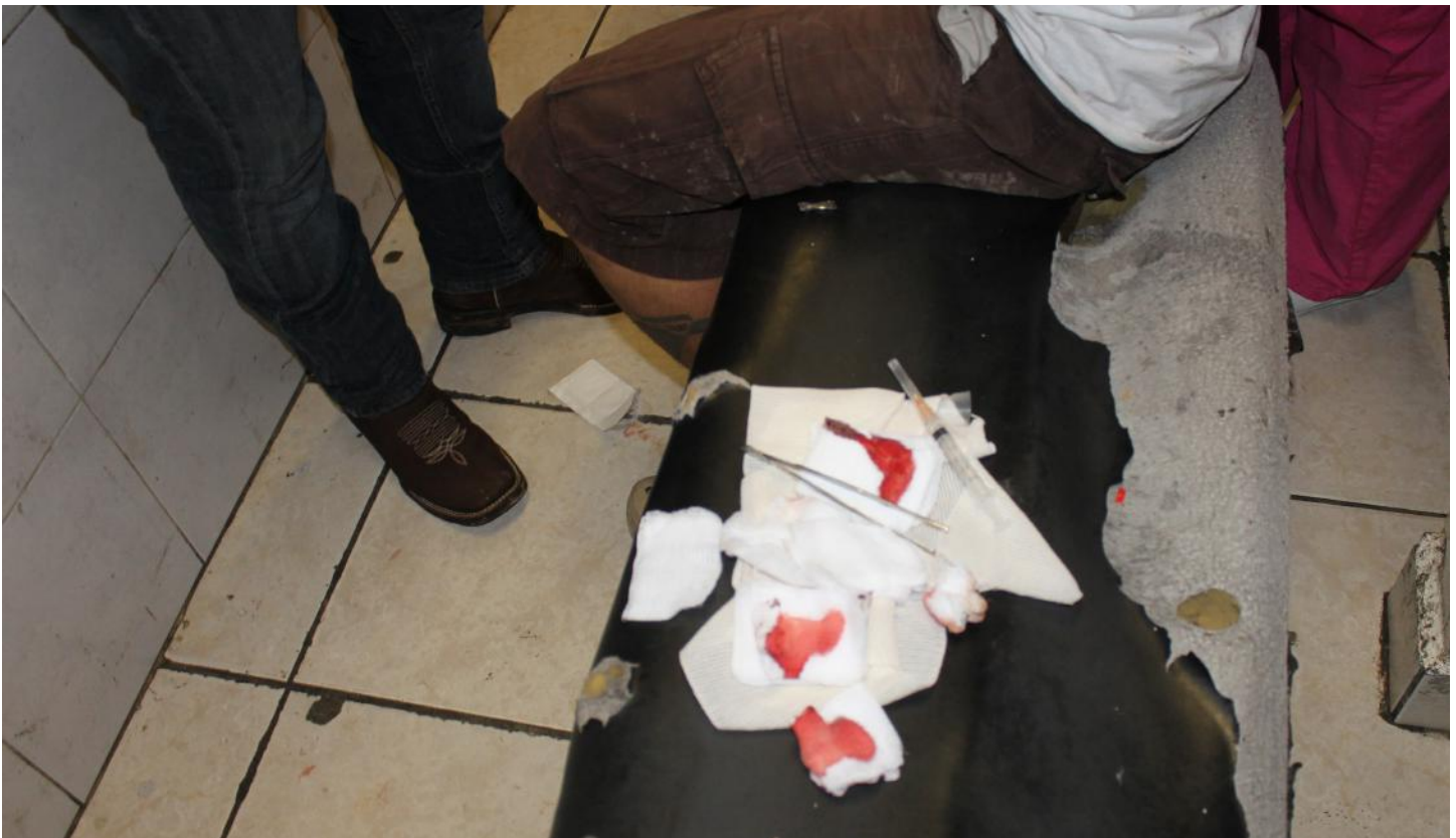
(20.2) El personal médico y de enfermería trabaja con instrumental insuficiente y en condiciones no propicias para la asepsia que es requerida.