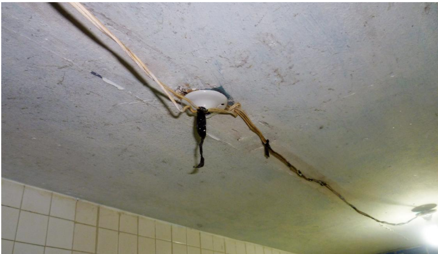
(15.2.) El área denominada Unidad de Reflexión no cuenta con luz ni ventilación natural, adicionalmente se observa que el funcionamiento del sistema de ductos de ventilación no es permanente.