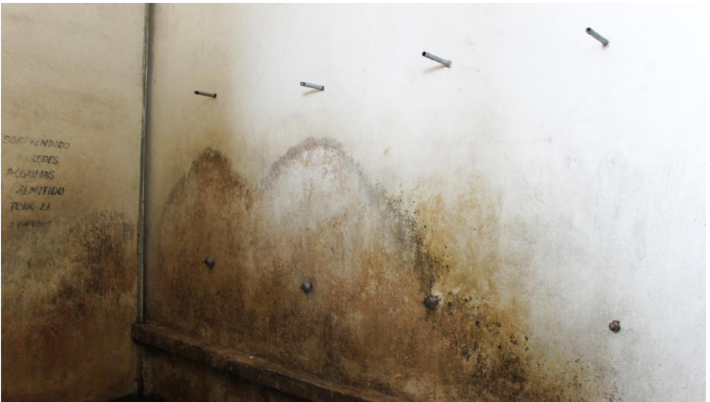
(14.2.) Los baños y regaderas no son suficientes, ni están en buen estado. Algunas áreas como la unidad de reflexión y observación no tienen suficientes sanitarios.