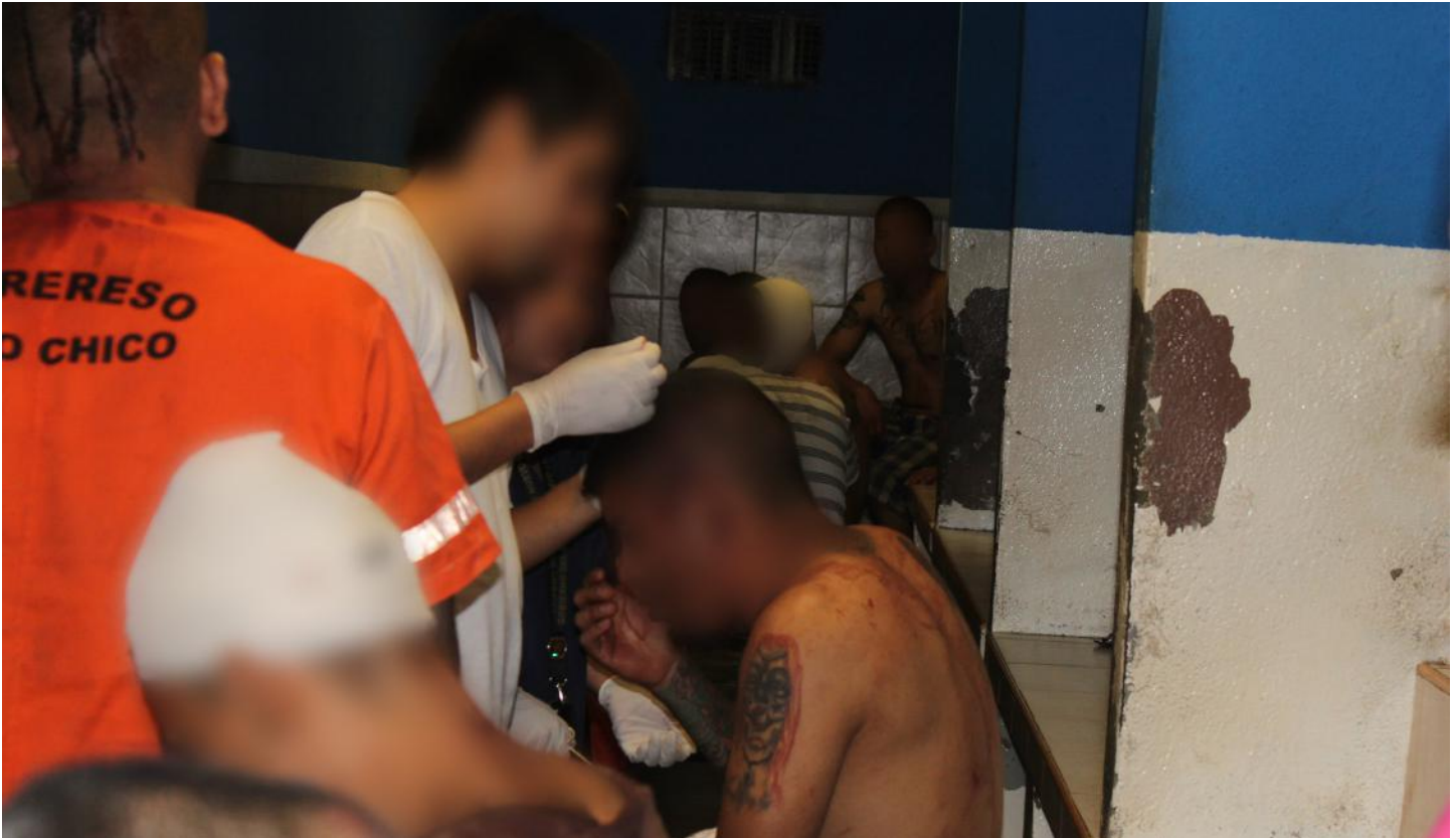
(19.1) Las internas e internos refieren omisiones de servicio y trato no adecuado.