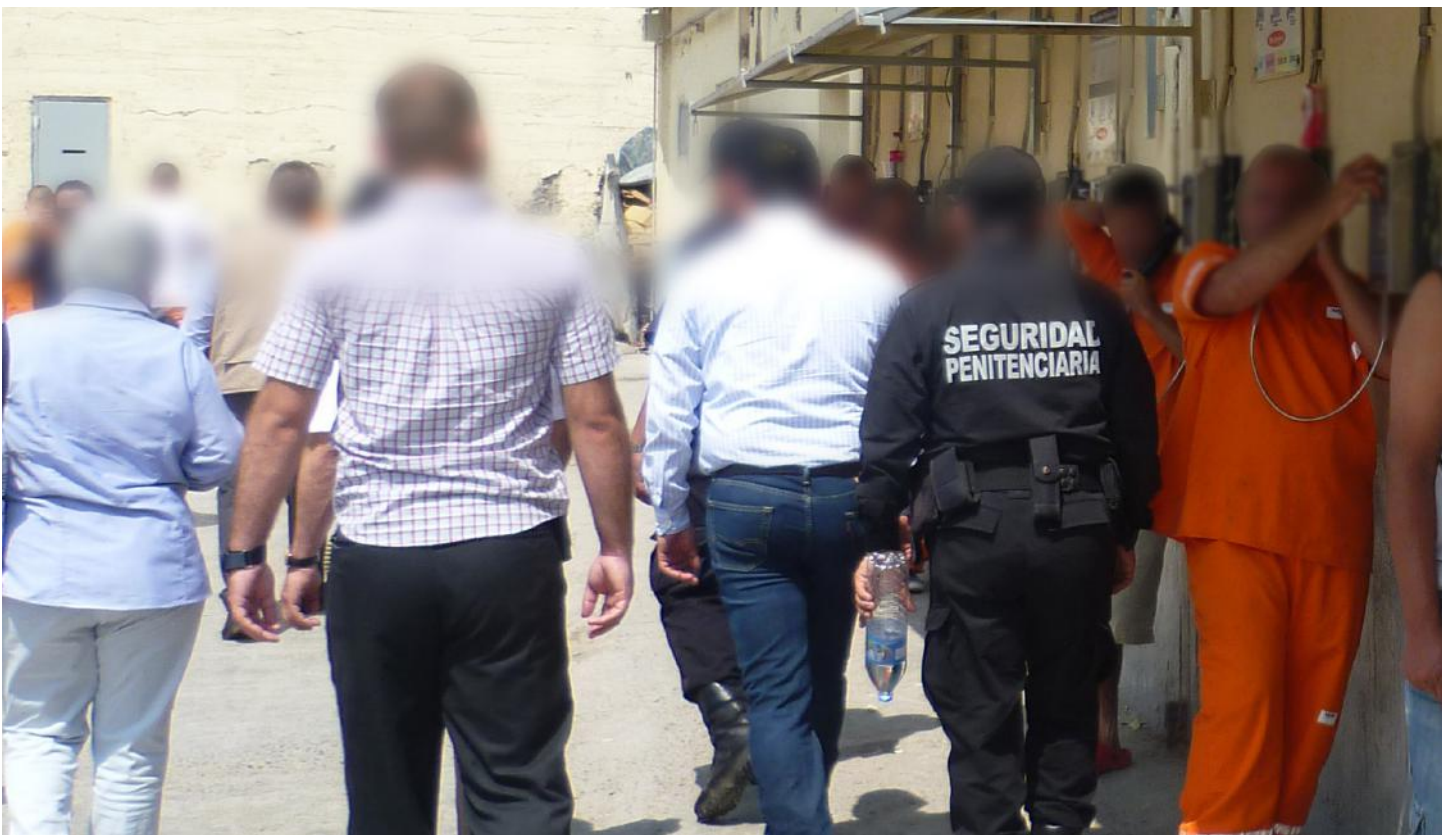
(25.) Los teléfonos (fijos y de líneas dedicadas) que representan la única vía de comunicación de las internas y los internos fuera de los horarios de visita, no se garantiza de manera permanente.