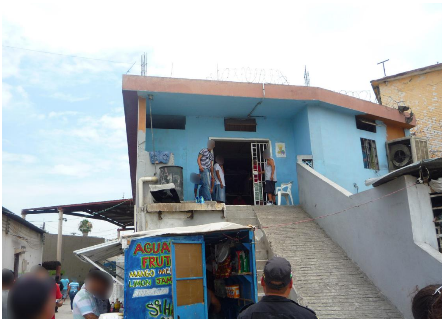
(4.2.) En materia de accesibilidad las condiciones estructurales del centro no permiten la movilidad de las personas con discapacidad tanto internas como de sus visitantes.

11. Si bien el equipo y tecnología de monitoreo para el control y la vigilancia al interior el centro se ha mejorado, se hace necesario su mantenimiento y ampliar su cobertura. 📷