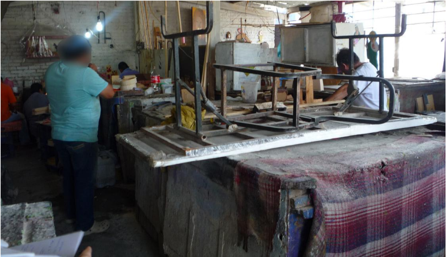
(28.) La ocupación laboral es insuficiente.