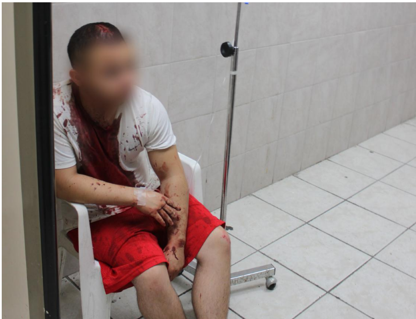
(19.) Derivado de las entrevistas directas se observa que tanto en las estancias de hombres como mujeres no hay personal médico y de enfermería en suficiencia para atender las necesidades que implica este derecho.

24. Finalmente, es importante señalar que el Centro Preventivo de Reinserción Social Topo Chico continúa alojando a personas con padecimientos mentales. Su estancia se encuentra marcada por mayor descuido y suciedad. Según los registros en la fecha de la visita, se alojan 40 personas con enfermedad mental, 84 inimputables hombres y 13 inimputables mujeres.