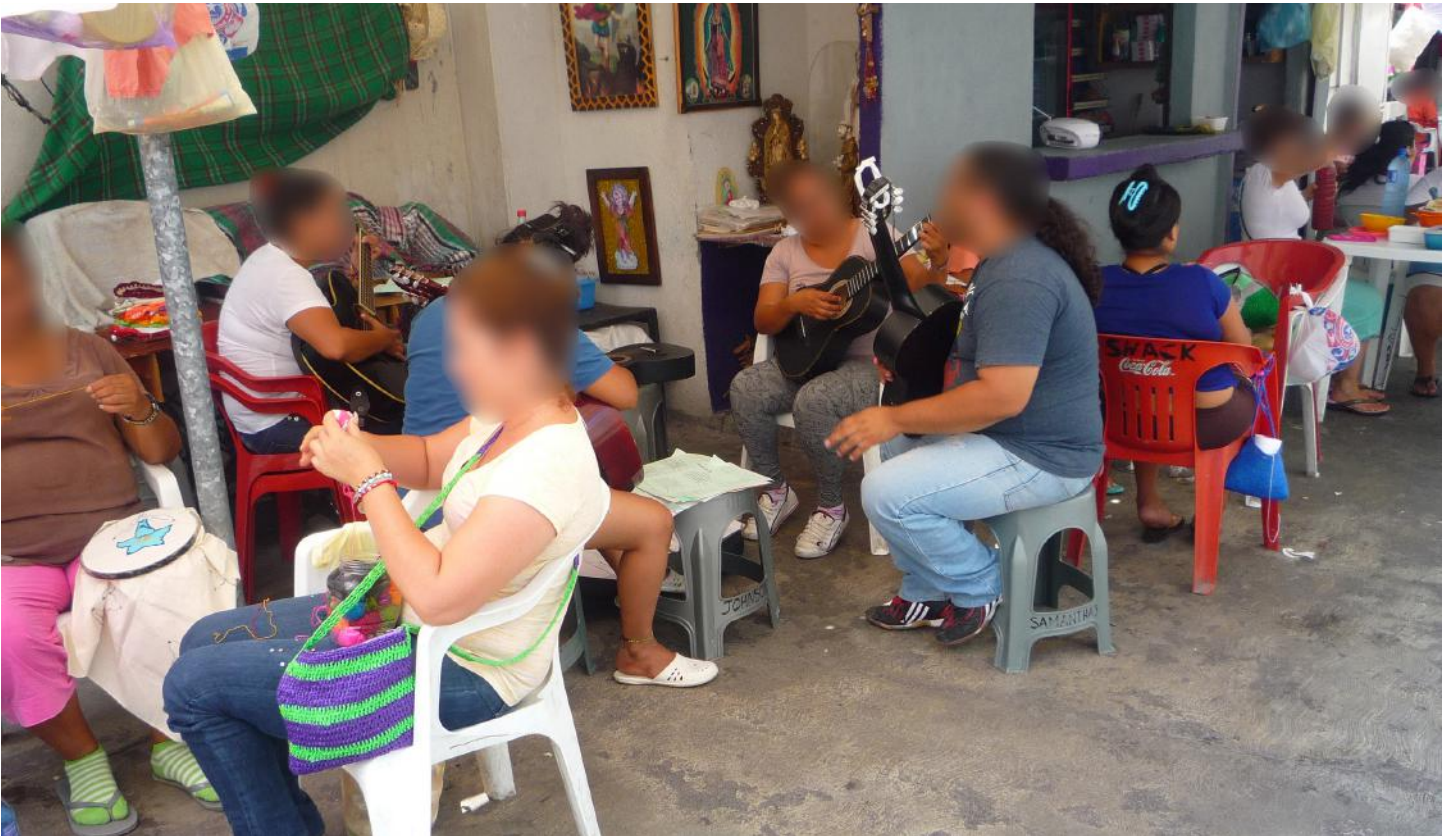
(26.) No existen espacios adecuados para convivir con la familia. Las visitas se llevan a cabo en espacios abiertos, sin techo, ni bancas.