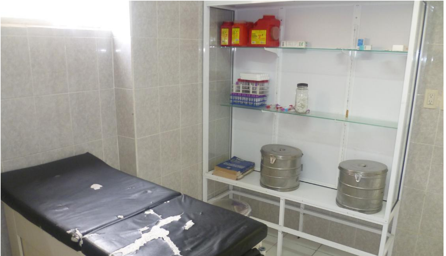
(22.) Es evidente el desabasto de medicamentos, situación que es referida por las y los pacientes internos y la visita de esta Comisión.