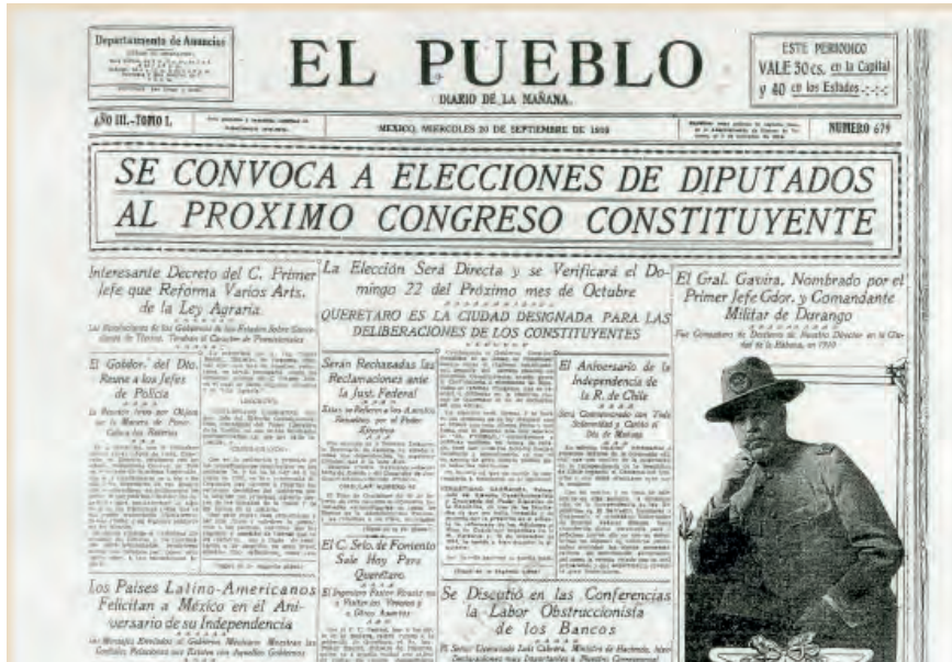
Portada del diario El Pueblo , miércoles 20 de septiembre de 1916.

El decreto que convocó al Congreso Constituyente, expedido el 14 de septiembre y publicado el 15 del mismo mes, se integró con un gran sentido político, considerando la advertencia sobre la difícil situación de confrontación en las distintas corrientes políticas. Se propuso un Congreso Constituyente para que, por medio del mismo, la nación expresara su soberana voluntad. En esta convocatoria, se confirmó el triunfo del constitucionalismo y, una vez realizadas las elecciones de los ayuntamientos en toda la República, el Primer Jefe del Ejército Constitucionalista, encargado del Poder Ejecutivo de la Unión, convocaría a elecciones para dicho congreso, estableciendo la fecha y los términos en que habría de celebrarse y el lugar para reunirse.