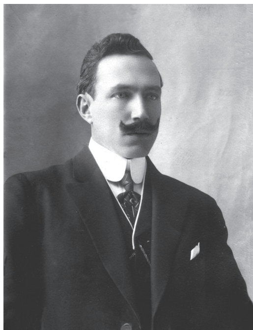
Salvador González Torres.

riodistas, hizo la aclaración de que se debería establecer para delitos de más de un año, y que podría haber muchos periodistas que cometieran delitos que se sancionen con menos tiempo, y para esto no se necesitaba el jurado, esto en el artículo 7o. También propuso una adición al artículo 9o. para castigar a los extranjeros que se inmiscuyan en nuestra política, como sucedió al final de la dictadura, cuando se organizó una manifestación exclusiva de extranjeros para apoyar la reelección del general Díaz. En otra ocasión, excitó el patriotismo del ingeniero Félix F. Palavicini para que en El Universal no se pusiera en ridículo a los diputados constituyentes. Defendió la federalización y reglamentación, por el gobierno federal, de las Guardias Nacionales y firmó la nueva Carta Magna. Fue electo Diputado al XXVII Congreso de la Unión. Fue asaltado el tren en que viajaba y fusilado cerca de Zitácuaro, Michoacán, el 5 de abril de 1918.