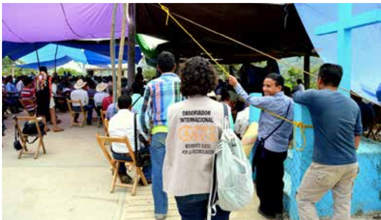
Labor de acompañamiento realizada por SweFor. Fotografía proporcionada por esta ONG Internacional