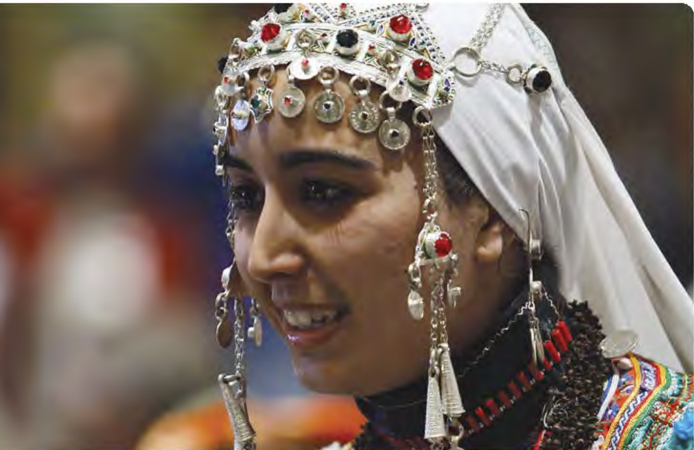
Una mujer indígena Amazigh (Marruecos) asiste al séptimo período de sesiones del Foro Permanente de las Naciones Unidas para las Cuestiones Indígenas.