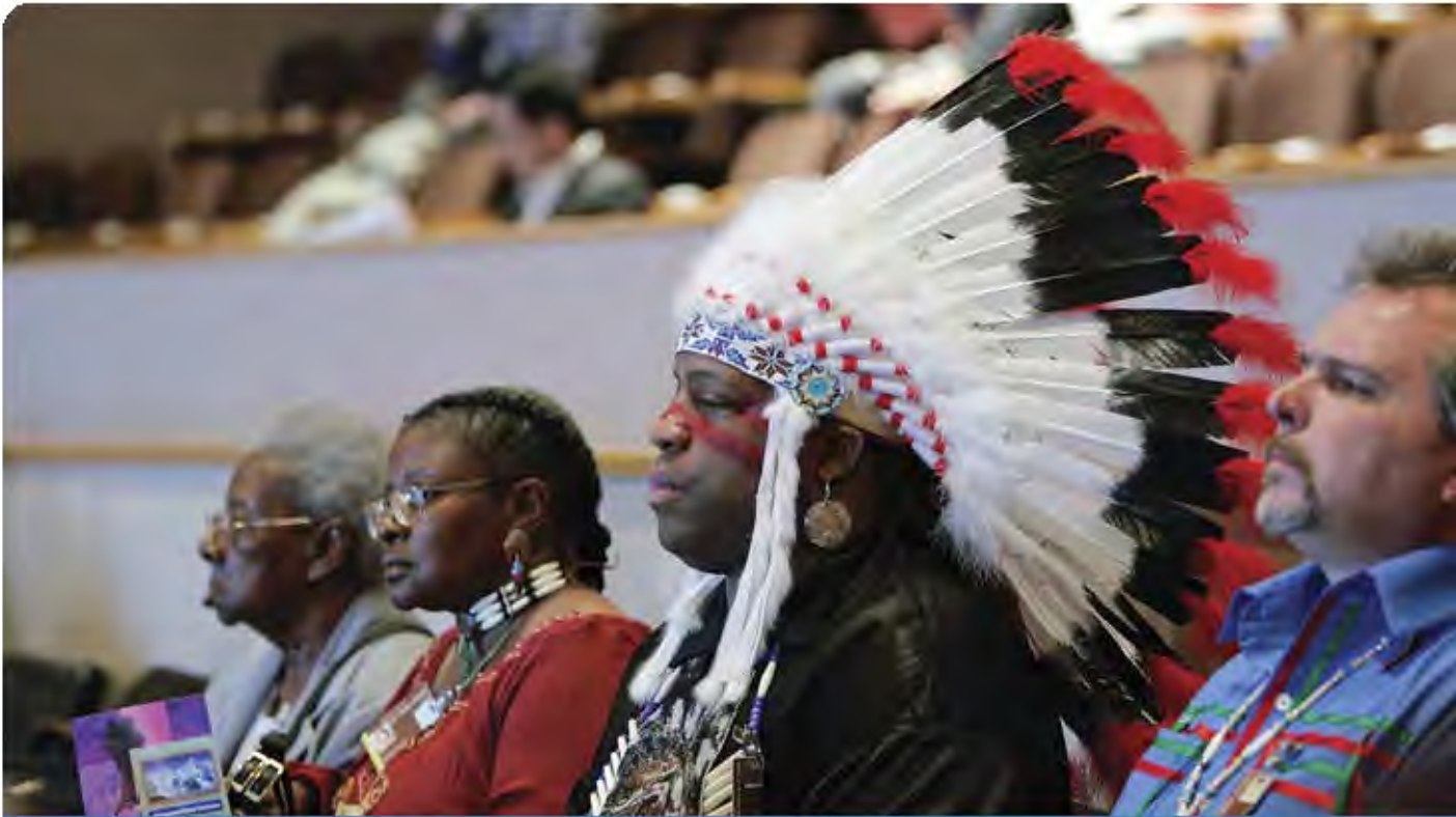
Un grupo de participantes asiste a la reunión plenaria del quinto periodo de sesiones del Foro Permanente para las Cuestiones Indígenas.