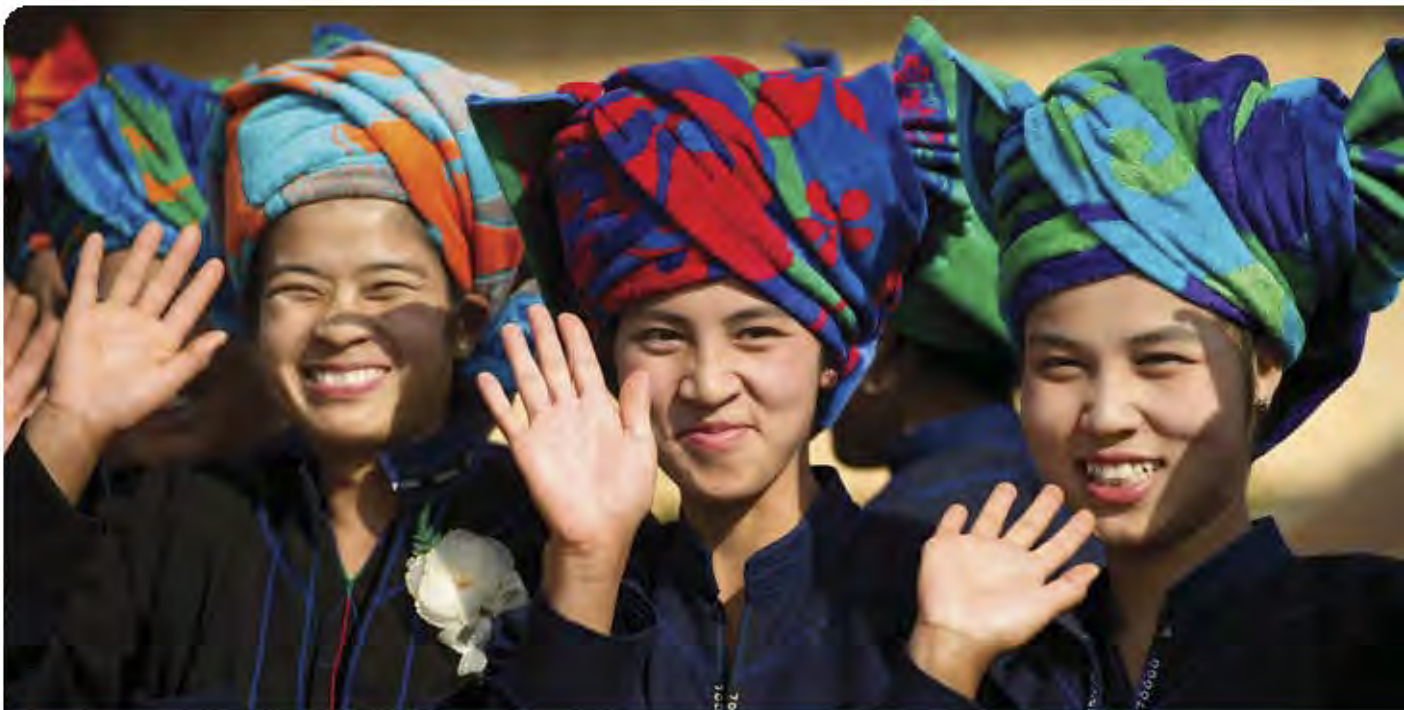
Vecinos de la aldea de Kyauk Ka Char, en el Estado de Shan (Myanmar).

También es necesario que las INDH sensibilicen a la población acerca de los procedimientos de presentación de comunicaciones que emplea cada órgano de tratado, que apoyen su utilización por quienes son víctimas de violaciones de derechos humanos y que ejerzan su sentido estratégico cuando promuevan los casos susceptibles de contribuir al fomento de la jurisprudencia en la materia. Además, las INDH pueden ampliar su función educativa a fin de incluir cursos de capacitación profesional sobre los procesos de aplicación de los tratados y de presentación de informes a los órganos competentes, dirigidos a los principales interesados nacionales e internacionales.