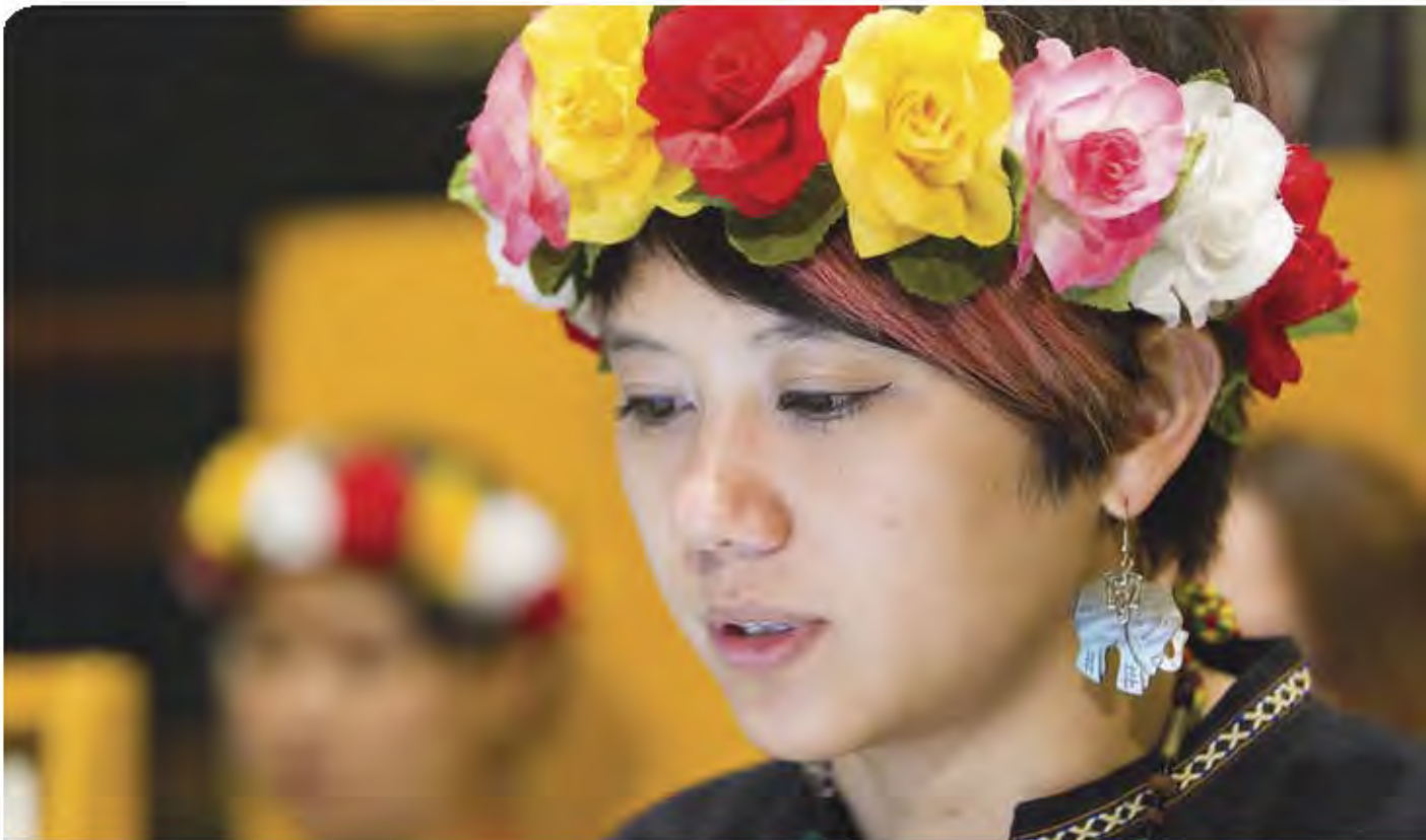
Un delegado indígena en la inauguración del duodécimo periodo de sesiones del Foro Permanente de las Naciones Unidas para las Cuestiones Indígenas.

El periodo de sesiones constituye una fuente importante de información actualizada sobre una amplia gama de cuestiones que afrontan los pueblos indígenas. Entre otras, esas informaciones proceden de las intervenciones de los oradores indígenas y de los delegados de sus organizaciones. Las INDH pueden aplicar luego en su labor cotidiana la información obtenida y las competencias adquiridas en las reuniones del Foro Permanente.