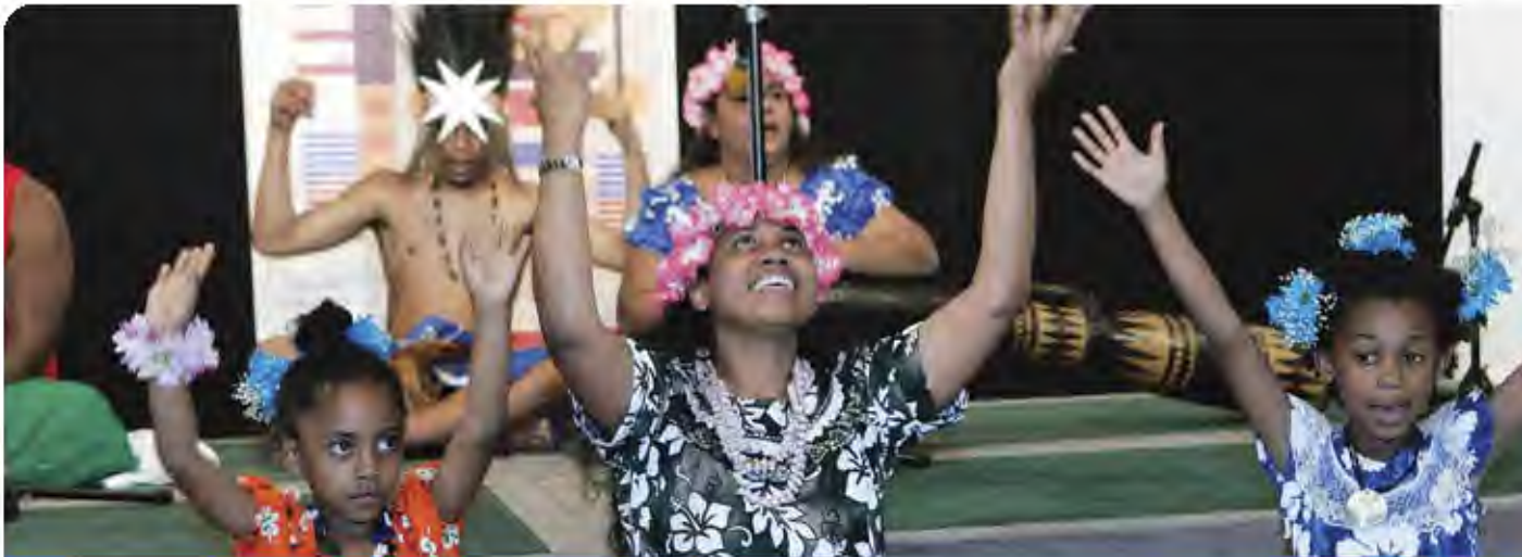
Aborígenes e Isleños del Estrecho de Torres (Australia) actúan en la ceremonia inaugural de la exposición cultural Indigenous Peoples: Honouring the Past, Present and Future .