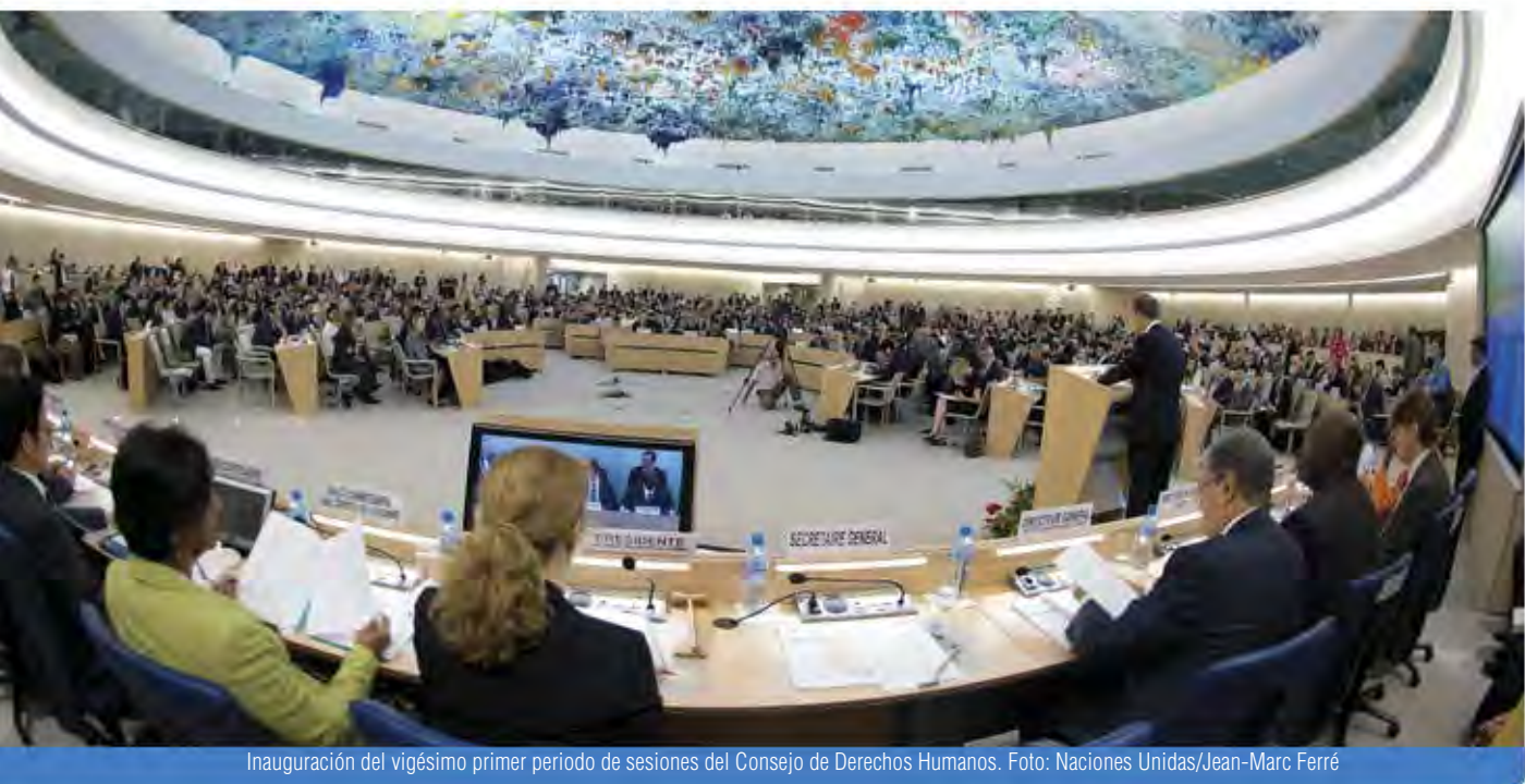
Inauguración del vigésimo primer periodo de sesiones del Consejo de Derechos Humanos.