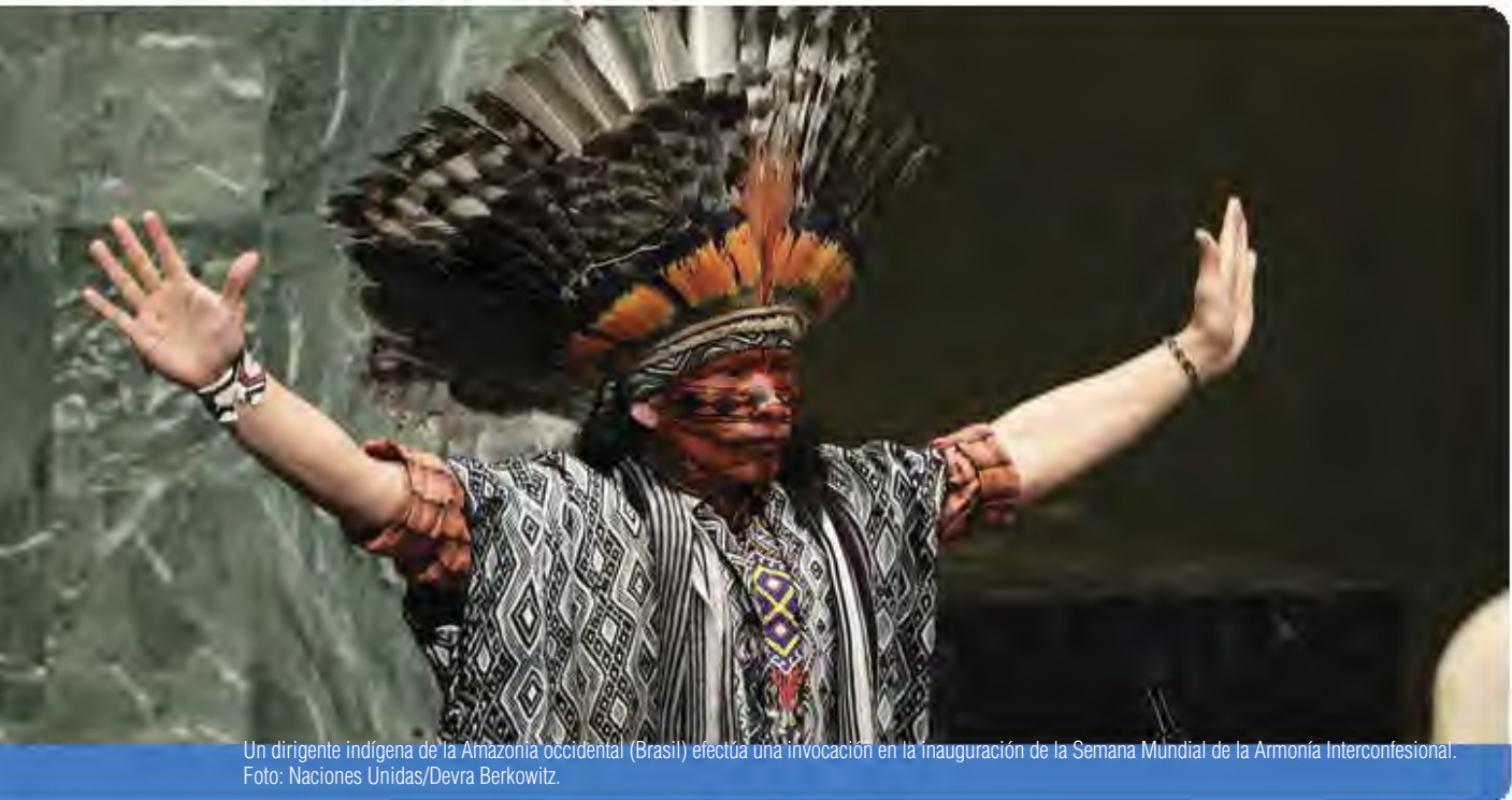
Un dirigente indígena de la Amazonia occidental (Brasil) efectúa una invocación en la inauguración de la Semana Mundial de la Armonía Interconfesional.

Tras la visita, el titular concluye el informe pertinente, lo da a conocer y participa en el diálogo interactivo durante la sesión ordinaria del Consejo de Derechos Humanos. Cuando se presenta el informe, la