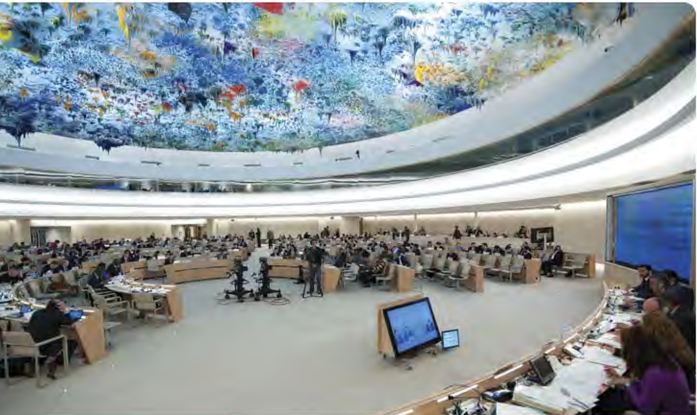
Décimo noveno período de sesiones del Consejo de Derechos Humanos. En este período de sesiones, los Estados Miembros examinaron, entre otros, los informes del EPU sobre Irlanda, Swazilandia, Siria y Tailandia, como parte del proceso de examen periódico de la situación de derechos humanos de los 193 Estados Miembros de las Naciones Unidas.