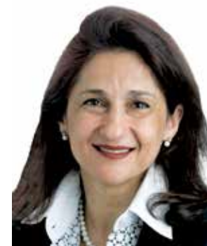
Nemat Shafik, Subdirectora Gerente presentó su renuncia el 18 de marzo de 2014