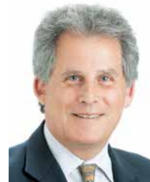
David Lipton, Primer Subdirector Gerente

El Informe Anual del Directorio Ejecutivo del FMI a la Junta de Gobernadores es un instrumento fundamental de rendición de cuentas dentro de la institución. El Directorio Ejecutivo, integrado por 24 titulares designados por los 188 países miembros, está encargado de dirigir los asuntos de la organización, en tanto que la Junta de Gobernadores, en la cual cada país miembro está representado por un funcionario de alto rango, es la máxima autoridad rectora. Por medio del Informe Anual, el Directorio Ejecutivo rinde cuentas a la Junta de Gobernadores del FMI.