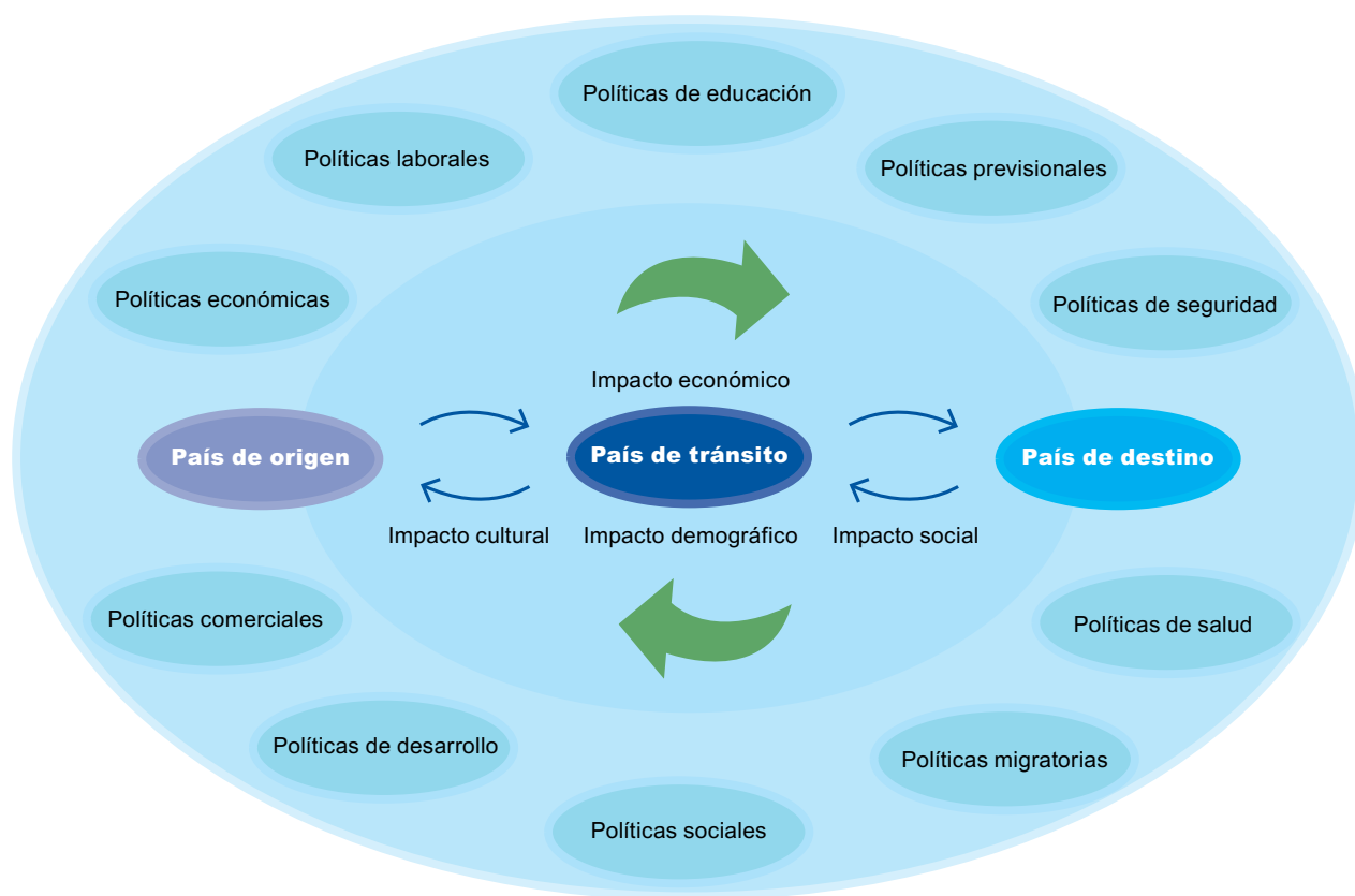
Diagrama II.1 IMPACTO DE LA MIGRACIÓN INTERNACIONAL Y POLÍTICAS RELACIONADAS