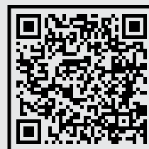
QR code agenda

Visite http://www.oas.org/es/sla/ddi/acceso_informacion.asp para futuras actualizaciones. Departamento de Derecho Internacional, OEA