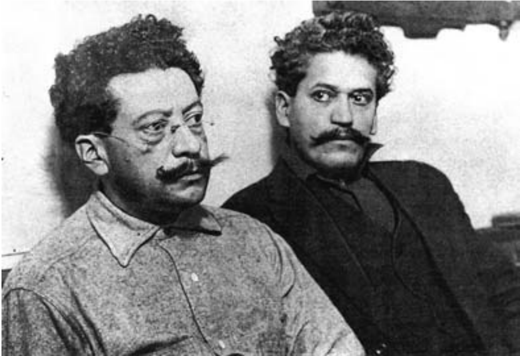
Ricardo y Enrique Flores Magón, oaxaqueños ideólogos de la Revolución Mexicana.

Otro aspecto que asienta es el de la igualdad ante la ley. Conforme a este formulismo todos son iguales ante la ley, que se fundamenta en el título 1, capítulo 1, que se refiere a las garantías individuales. Estos principios son irrefutables y homogeneizaron a millones de indígenas, integrándolos al proyecto nacional, con lo que se hizo “igual a los desiguales”. Al respecto, el artículo 1º Constitucional establece: