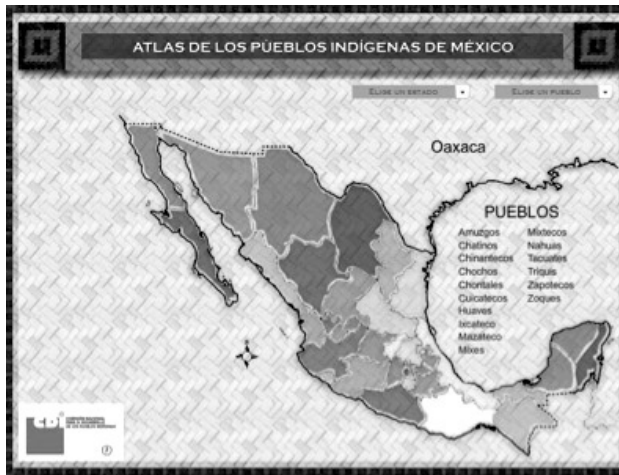
Mapa 2. Pueblos indígenas de Oaxaca