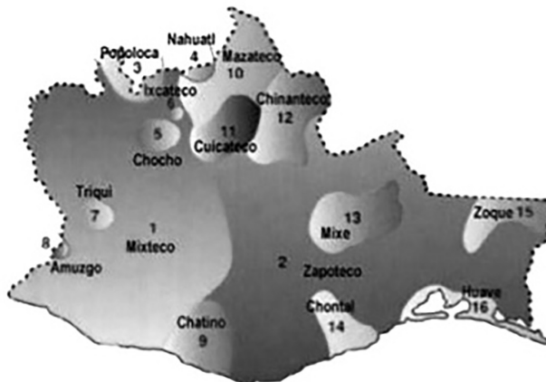
Mapa 3. Grupos étnicos de Oaxaca

La pluralidad étnica y cultural en el estado muestra que Oaxaca está compuesto por una diversidad de cosmovisiones asentadas en diferentes territorios, con población propia y normas particulares, dando así un fundamento para la creación y existencia de un pluralismo jurídico. En el mapa 3 se identifica la ubicación geográfica de los distintos grupos culturales.