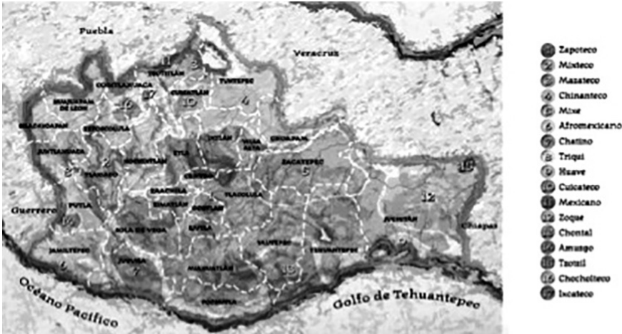
Mapa 4. División distrital, regiones y pueblos indígenas