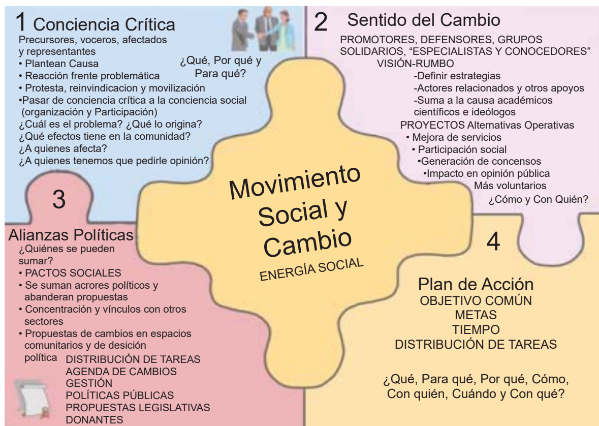
FIGURA I MOVIMIENTO SOCIAL Y CAMBIO.

La Democracia Creativa se basa en la fuerza y talento de los integrantes de la sociedad para generar un movimiento social que incida en cambios de lo “público” y lograr los cambios que la sociedad requiere, estos pasos los analizaremos en cuatro etapas: Conciencia Crítica, Visión de Cambio, Alianzas Estratégicas y Plan de Acción.