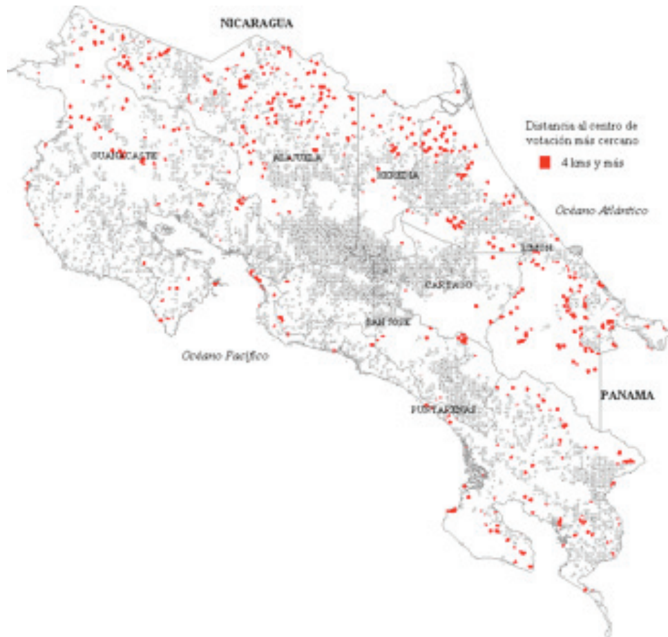
Gráfica 2. Accesibilidad a los centros de votación, Costa Rica 2002