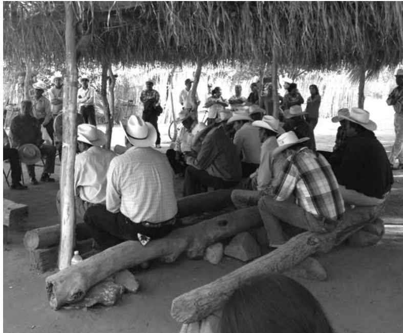
Nu ndu iin ra cumi tyiñu naha ra.