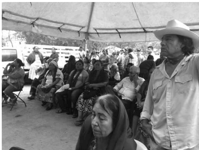
Nu ndu iin nyivi Switchi, nu cuví Sonora, nu jahá cuenda ñi ñuu ñi.