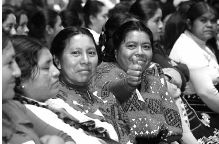
Ñi ñaha nyehé ñi tyiñu cuenda política.

Tan tsitsi tuhun ihya quita tandihi ca maa ndatu tsa iyó tsi ñi tsa cuvi ñi nyivi ñuu, tyin tacan tan coto ñi nacaa taahan tsi cua jatyinyee ñi tiin tyiñu cuenda tsa vaha tsi ñi tan ña cua jativi can cuhva iyó ñi. Cuvi juvin ñi maa ñi cua nyehe tyiñu can o cua ndacan ñi tsi ra cumi tyiñu javaha ra naha cuhva caahán maa ley, nacaa cua javaha ñi tsihin cuhva tsitó maa ñi.