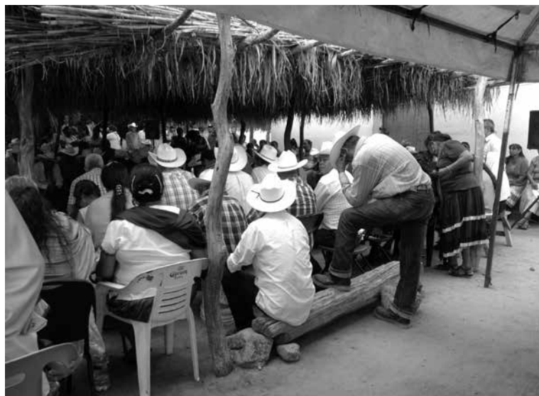
Nu ndu iin nyĭvi Switchi, Sonora.

Ña cuvĭ cundaa can tyin nditsa tsa ña javahā ra naha, yacan cuenda janduvahā ra tsa cuvĭ (per saltum) tyin tacan tan ña coo tisihi tsihin ra yĭhi cuenda Nunduva tan Vehe cahnu tsa nyehe cuenda tsa nducú nyĭvi yoo cua cuvĭ tyiñu ñu uñi.