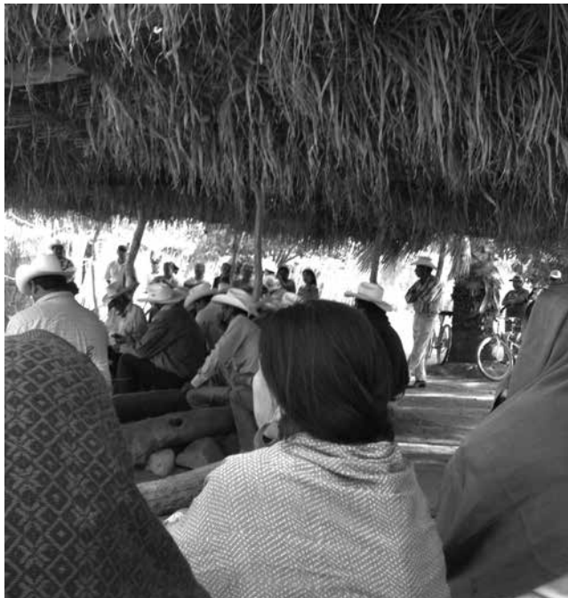
Ñi ñaha ndu iin ñi tsa ndu iin nyívi ñuu.

Tan iin cuhva tsa javahá ra nyehé tyiñu cuenda tsa nducu yo yóo cua cuvi tyiñu, tsicoo ra naquihin ndaahvi tsi nyívi tsa cuenda nyívi ñuu. Tyin tacan tan ña yíi cua cundaa náa iin tsa cua cuvi tsi ñi. Tan inga tucu tyiñu cua nyehé ra naha yacan cuvi tsa janaha ra naha tsi nyívi tyin inducu ñi taahán tsi cutuñi ñi, iyó ndatu tsi ñi nducu ñi yóo jatyinyee tsi ñi. Tan yóo jacoto tsi ñi cuhva iyó tsa nducu tsi ra cua cuvi tyiñu ñuu. Cuñi tsi coto ñi tyin ña taahán tsi tyahvi ñi tun iin ra cua jatyinyee tsi ñi cuhva cuenda ra naca taahán tsi javaha ñi. Tan taahán tucu tsi nacoto ñi tyin catyí ley tyin taahán tsi coo iin ra cua jatyinyee tsi ñi tun ña tsitó ñi sahan, iin ra cuvi caahán yuhu caahán ñi tan nacoto ra cuhva iyó ñi.