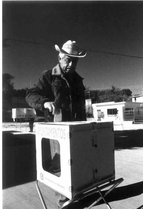
Nu tyihi iin ra tutu tsa tsaca ra.

Tan iin cuhva cuvi nyehe yo tan coto yo, yacan cuvi tsa cua nyehe yo ndaa ndatu iyó tsi nyivi cua cuvi naquihin ndaahvi ra naha, quivi cua nducu nyivi tsi ra cua cuvi tyiñu, nacao cua javaha ra cuvi político naha ra tan yoo inga ca, ihya vatsi sívi can: