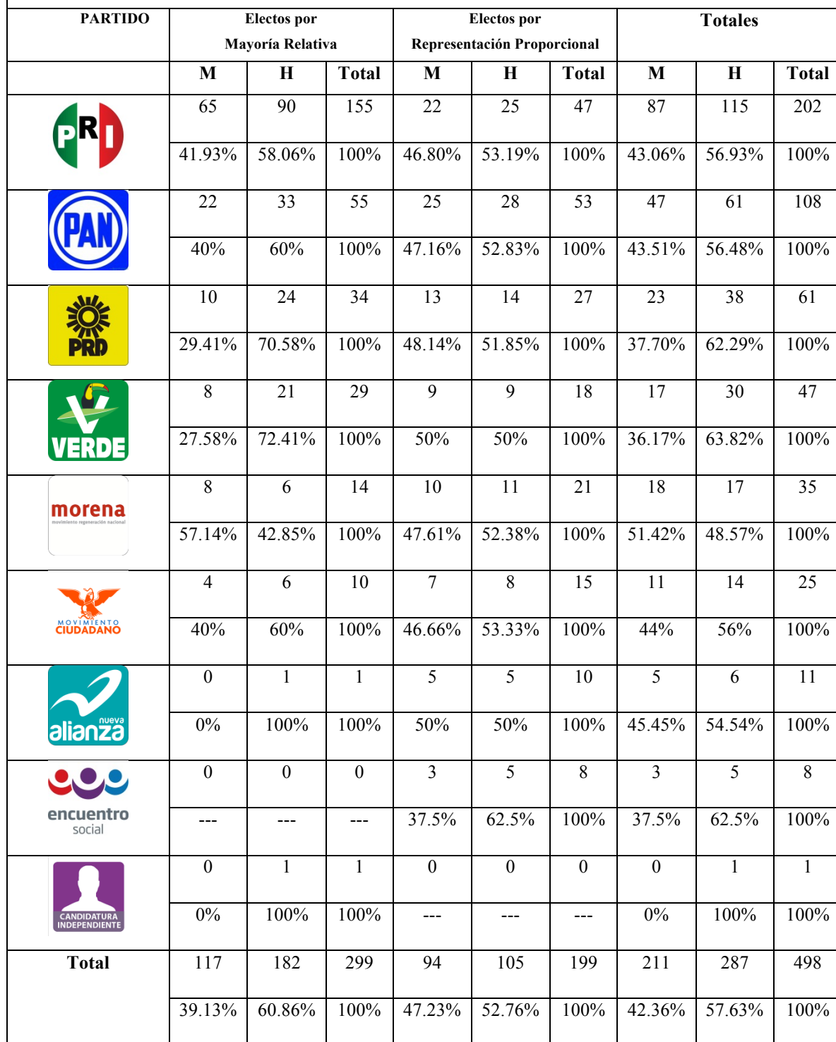
Tabla 1. Representación por género, partido y principio en la Cámara de Diputados