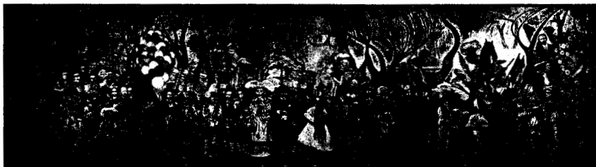
Sueño de una tarde dominical en la Alameda Central. Museo Mural Diego Rivera. Balderas y Colón. Centro Histórico de la Ciudad de México