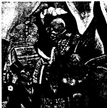
Sueño de una tarde dominical en la Alameda Central.