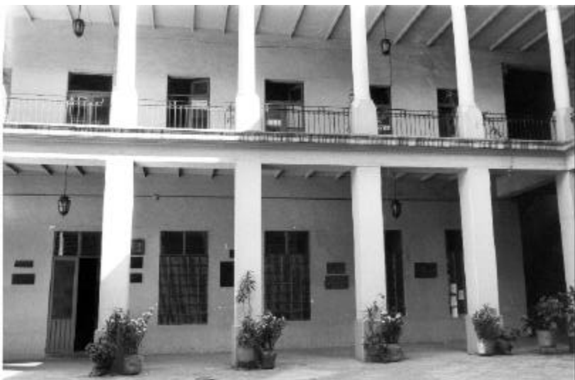
Vista parcial del patio principal de la Escuela Nacional de Jurisprudencia, que muestra el muro oriente de dicho patio, correspondiente al Aula Magna Jacinto Pallaes, donde nació el Instituto de Derecho Comparado en mayo de 1940.