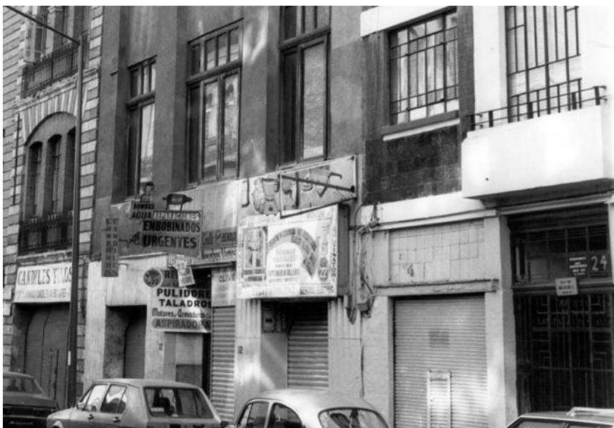
Edificio número 22 de la calle Artículo 123, en uno de cuyos despachos se instaló el Instituto de Derecho Comparado, parece que en el tercer piso.