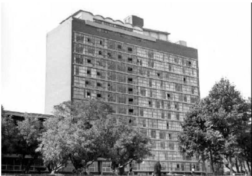
Edificio de la torre de Ciencias que se convirtió en Torre Dos de Humanidades, donde los pisos cuarto, quinto y la mitad del decimotercero, los ocupó el Instituto de Investigaciones Jurídicas de la UNAM.