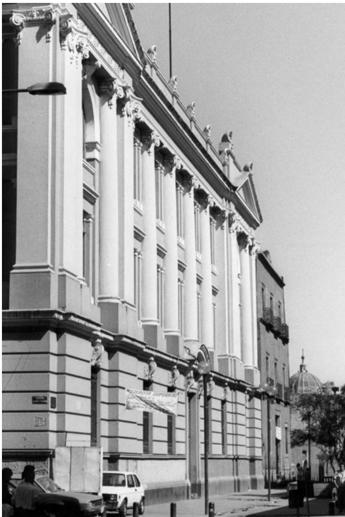
Fachada principal de la entonces Escuela Nacional de Jurisprudencia y su edificio "anexo", calle de San Ildefonso esquina con Argentina, Centro Histórico, ciudad de México.

como base del emblema un libro abierto; la equidad y justicia, que representan las balanzas, como símbolo de la solución de alguna problemática social, y las siglas del propio Instituto.