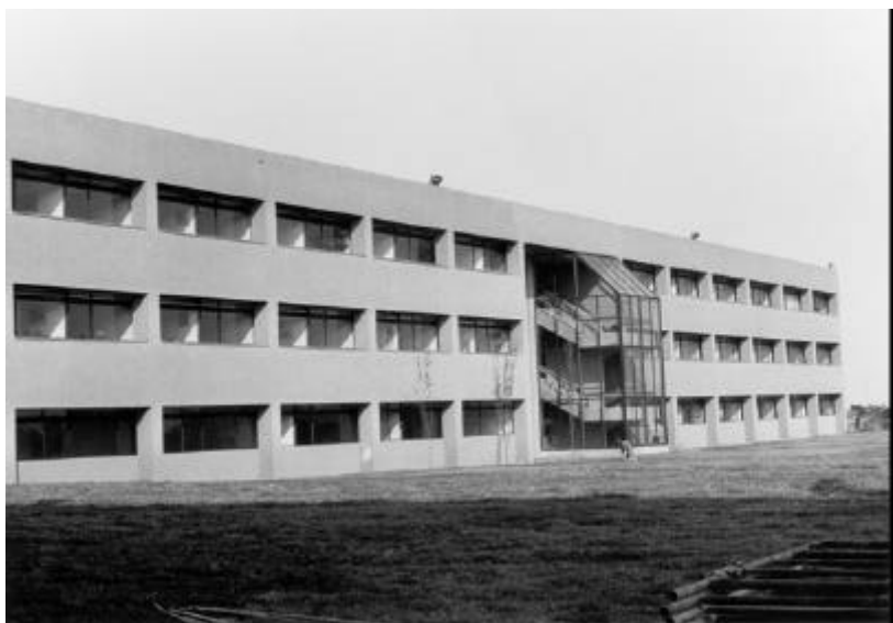
Edificio actual del Instituto de Investigaciones Jurídicas de la UNAM, fachada que mira al campus de la Ciudad de la Investigación en Humanidades en el área sur poniente de Ciudad Universitaria, Pedregal.