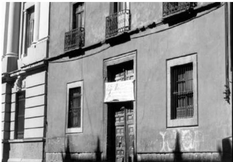
Edificio "anexo" a la Escuela Nacional de Jurisprudencia, por la calle de San Ildefonso, en cuyo tercer nivel (azotea), habrá un pequeño salón con tres balcones hacia la calle y donde se alojó al Instituto de Derecho Comparado.