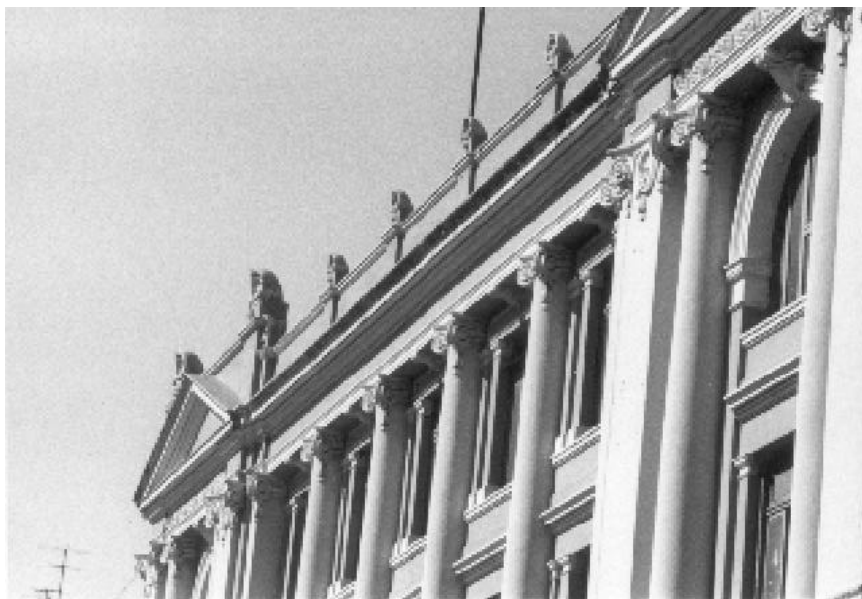
Los tres balcones del edificio "anexo" del tercer nivel que correspondían al Instituto de Derecho Comparado.