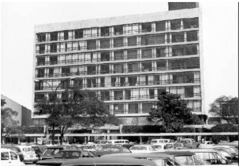
Edificio conocido como la Torre Uno de Humanidades, Ciudad Universitaria, cuyo tercer piso ocupó el Instituto de Derecho Comparado, donde se transformó en Instituto de Investigaciones Jurídicas.