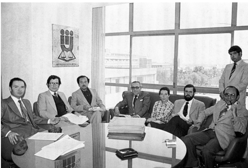
SESIÓN DEL CONSEJO INTERNO DEL INSTITUTO (1980)